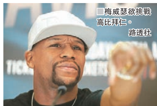
梅威瑟欲挑戰高比拜仁。

今年40歲的梅威瑟，向來就是個籃球愛好者，他多次在自己的社交平台發佈其打籃球的影片，也和多名NBA球星是好友，例如騎士後衛湯馬士。不過這次梅威瑟自己在高比拜仁的社交平台上留言寫道：「高比拜仁，我已經準備好和你一對一單挑，賭注是100萬美元！」