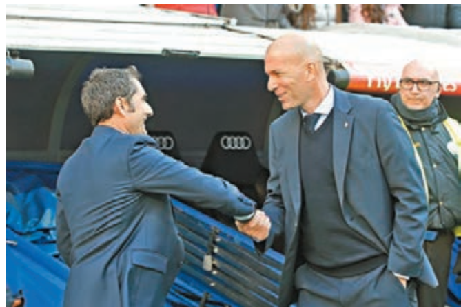
華維迪(左)與施丹在賽前握手示好。

巴塞羅那昨日在西甲「國家打吡」中，作客以3:0大勝10人應戰的皇家馬德里，雖然目前領先少賽一場的皇馬14分，但是巴塞主帥華維迪賽後表示，西甲爭霸未完。對於冠軍是不是已經鎖定的問題，華維迪表示：「很顯然沒有。聯賽上半程都還沒結束。我們有優勢，但巴塞不會只盯着這個。我們對自己的比賽、分數以及感覺感興趣。」