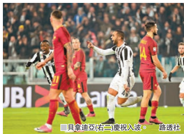
貝拿迪亞(右三)慶祝入球。