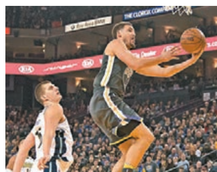
勇士主將基利湯遜(右)上籃。