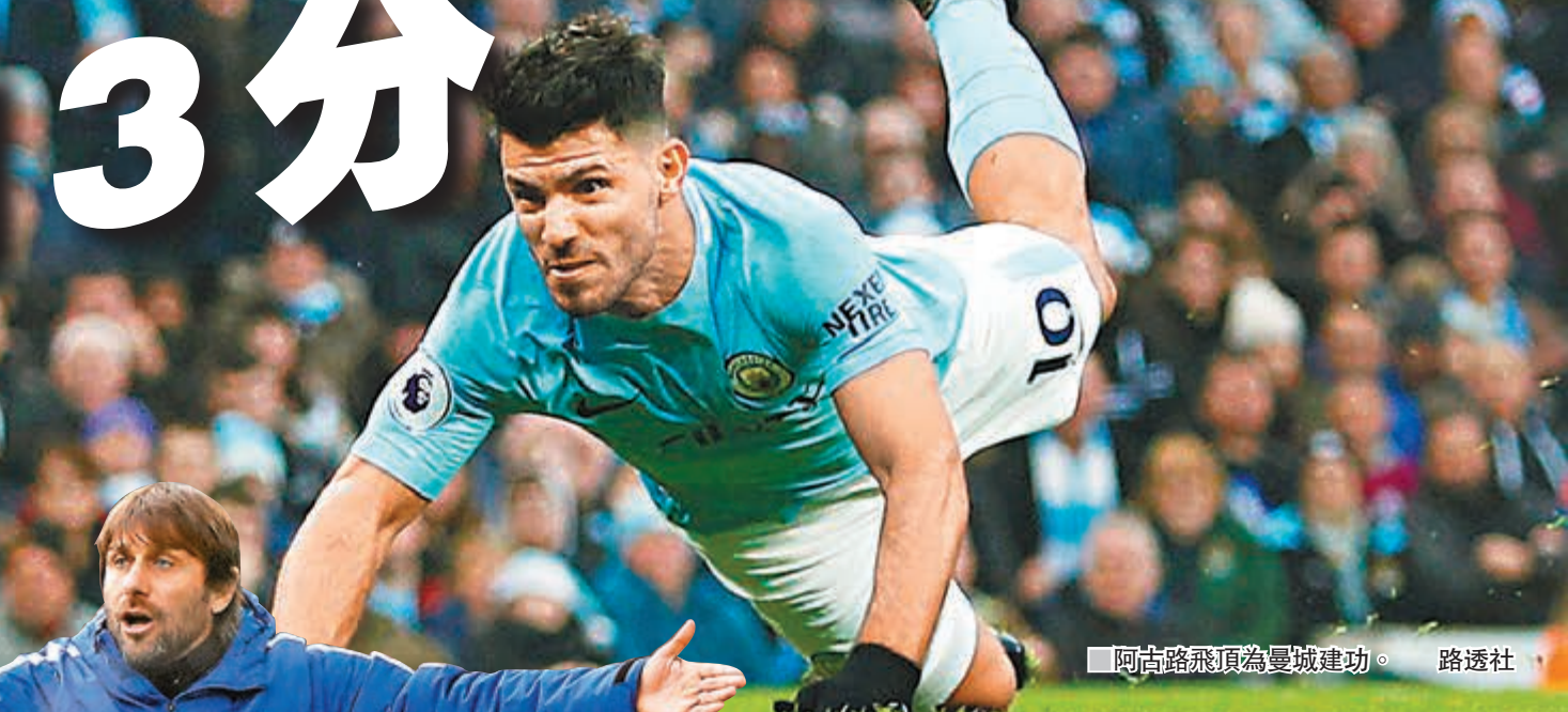
阿古路飛頂為曼城建功。