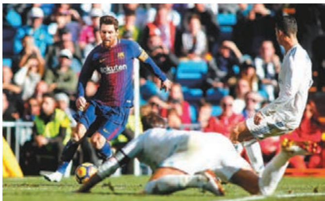
美斯(左)甩鞋助功。