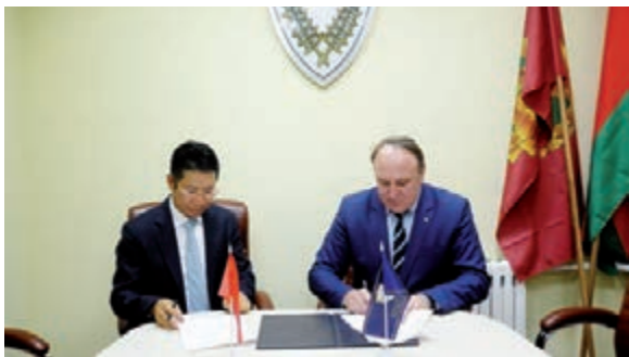
■與明斯克律師協會簽訂合作備忘錄