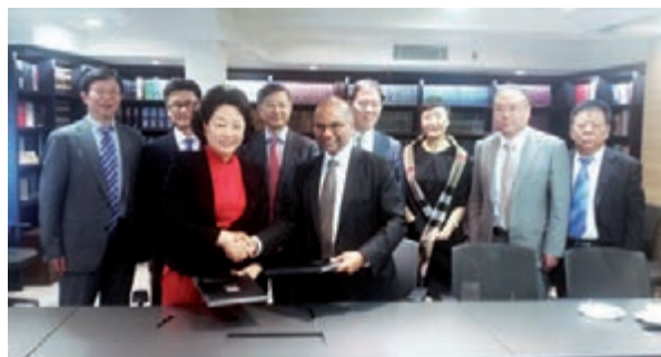
■與新加坡律師協會簽署《合作協議》

此次交流訪問，北京市律師協會以實際行動積極主動參與國家「一帶一路」建設，積極發揮北京律師在中俄、中日經貿往來中的保障和促進作用，開啟了北京市律師協會作為民間組織積極融入國家立體外交佈局的新篇章。