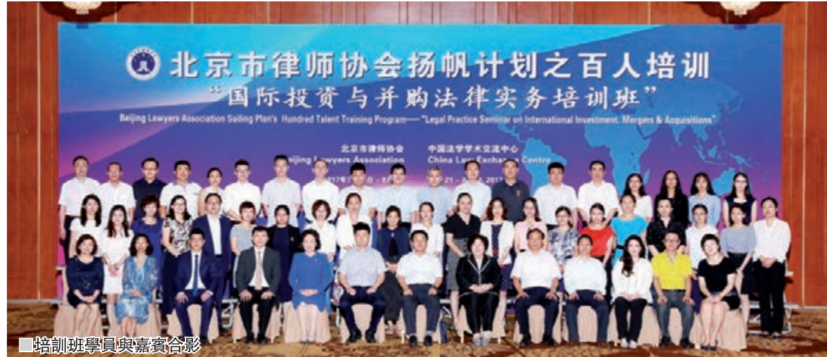
■培訓班學員與嘉賓合影

北京市司法局相關負責人對此次培訓亦給予了高度肯定，並勉勵北京市律師協會認真貫徹落實《關於發展涉外法律服務業的意見》，結合北京律師行業實際，研究提出促進首都涉外法律服務業的具體措施，支持和引導律師事務所為中國企業「走出去」提供多樣化的跨境法律服務，努力打造一批通曉國際規則、善於處理涉外法律事務的涉外律師人才隊伍。