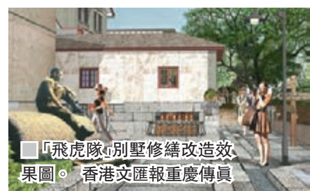
「飛虎隊」別墅修繕改造效果圖。

香港文匯報記者從重慶渝中區獲悉，該區將利用豐富的抗戰文化資源，投資2.4億元人民幣，將李子壩正街進行修繕保護，建成抗戰歷史文化展示區。值得一提的是，重慶將用木結構「補充」美軍飛虎隊辦公樓遺址，隔上玻璃，並在此地打造飛虎隊主題客棧，讓遊客全方位感受抗戰時期的「飛虎隊」。