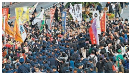
昨日午後，大批抗議民眾高舉標語走上台北街頭，要求台灣當局撤回「勞基法」修正案。

香港文匯報訊 據新華社報道，昨日午後，大批抗議民眾高舉標語走上台北街頭，要求台灣當局撤回「勞基法」修正案。抗議活動發起單位表示，預估近萬人參加此次遊行。