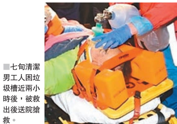
七旬清潔男工人因垃圾槽近兩小時後，被救出後送院搶救。