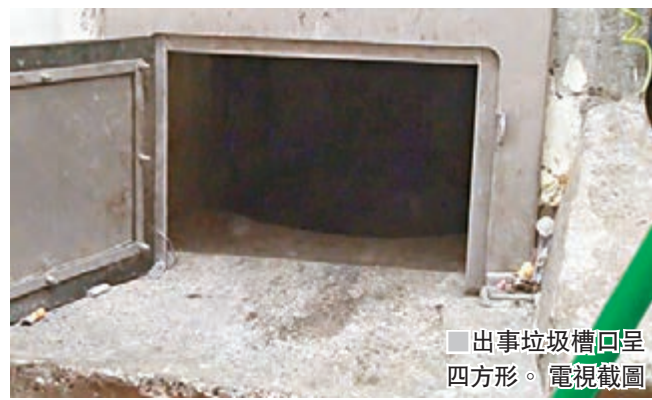
出事垃圾槽呈四方形。