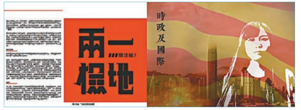
最新一期的《城大月報》設專題，不遺餘力地抹黑「一地兩檢」。《城大月報》截圖