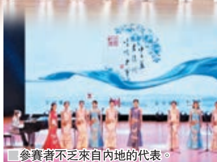
參賽者不乏來自內地的代表。