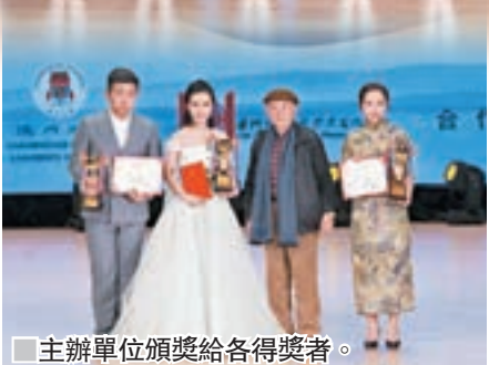
主辦單位頒獎給各得獎者。