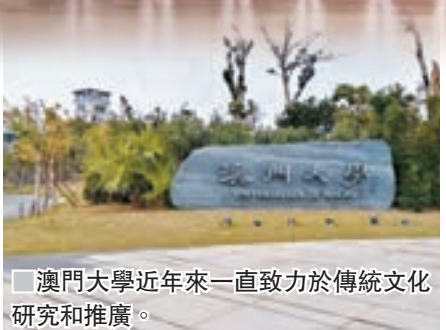
澳門大學近年來一直致力於傳統文化研究和推廣。

參賽者來自全國各地，有中學生，也有小學生，甚至有幼兒。藝術意象的加入使得詩歌具有的文字意義變得更加立體和凝練。在12月16日的決賽中，一支參賽隊伍吟唱朗誦了《盧溝謠》。參賽者不僅是將詩詞從書面文字變成了聲音，更加運用多種符號將現場觀眾帶入了歷史感極強的背景語境中。參賽者穿上了上世紀二三十年代風格的學生服裝，依靠聲光電的技術，在背景中呈現了北京盧溝橋的畫面，