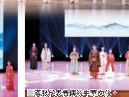
漢服代表着傳統中華文化。

而這一畫面的背後則是中國人開始全面抗戰的起點。而在朗誦的過程中，參賽者表達出全神貫注的投入，在朗誦的結尾展現出了五星紅旗的意象。透過這樣的方式，歷史與現實、台上與台下、參賽者和聽眾之間形成了一種極為巧妙的心靈互動。