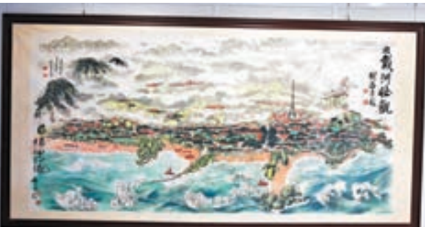
諸葛志潤的代表作之一《北戴河壯觀》。