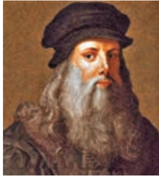
有指達文西所做的全都是其個人喜好。

達文西對科學觀察，具有獨特的直覺理解和「怪異」的預見。作者認為，達文西的科學分析，比牛頓的第一和第三「慣性定律」，足足早了200年。