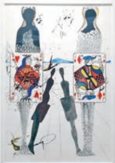
達利《愛麗絲夢遊仙境》系列版畫之《王后的槌球場》