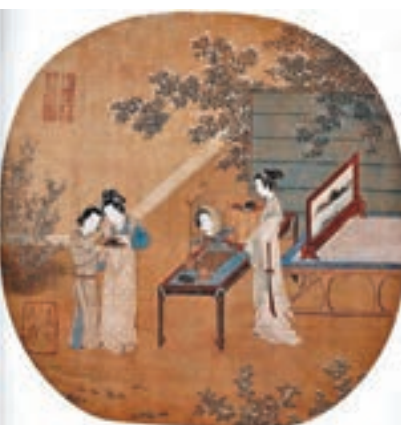
仇英所作的仕女圖

因為堅實的基本功，再有流通量小的加持，今日，仇英的作品不僅有研習價值，也有非常高的收藏價值。所以，仇英的作品只要真跡出場，都會寫出不俗的數字。2009年香港長風春季拍賣，仇英《文姬歸漢長卷》成交價達到了1.12億美元。2010年，北京瀚海拍賣仇英的《浮鑾暖翠圖》，經過收藏人士的幾番競價，最終以7.28億一槌定音。2012年，紐約蘇富比拍賣仇英的畫作《西園雅集圖》，最終以9.5億美元成交，刷新了仇英畫作拍賣的世界紀錄。