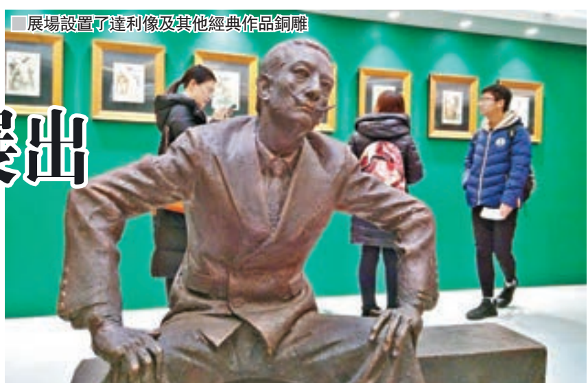
展場設置了達利像及其他經典作品銅雕