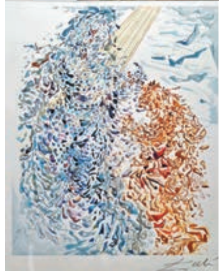
達利的《神曲》系列作品