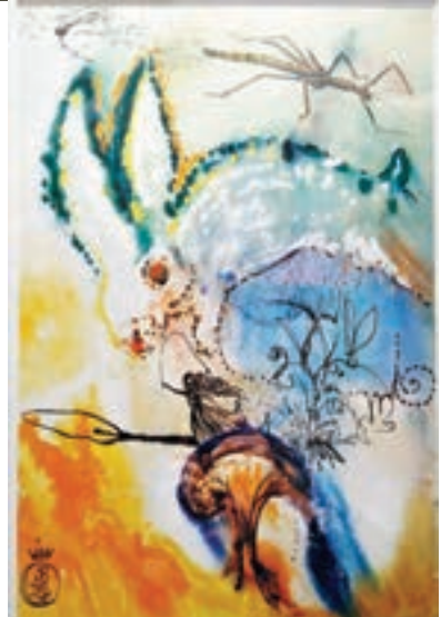
達利《愛麗絲夢遊仙境》系列版畫之《掉進兔子洞》