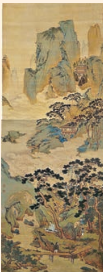
明仇英《玉洞仙源圖》立軸 絹本 設色

畫作內容而言，奇峰峻嶺蒼松翠柏，瓊樓水閣，溪水潺潺的溶洞前，一隱士臨流盤膝，停琴靜坐，侍童們忙著煮茶、端盤、陳設古玩，儼然人間仙境。同時，此圖用大青綠設色，細勁的線條勾勒輪廓，濃艷的石青石綠渲染山石，同時融以細密的皴法，追求色調的和諧，在宗法南宋青綠山水大家趙伯駒的基礎上有所變化，代表了仇英青綠山水的典型畫風。