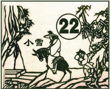
■鋒刀薄紙，眉目傳神。

任何新曆舊曆節日齊備，五一五四運動，連同觀音達摩誕花公花婆節都沒有遺漏，二十四節氣更不必說了，聖誕前三日立冬，年年準確無誤，我們天文學老祖宗真是了不起的精算師。枱曆最大的心思是每逢碰上適當時令，還配上貼近該節氣內容的剪紙或紙刻，這種上世紀流行於鄉村的民間工藝，通常是用大紅紙剪刻而成，今日城市坊間已難看到，偶然看到的已是印刷品了，而且也多是福祿壽圖案和古代的名將美人，這枱曆選用