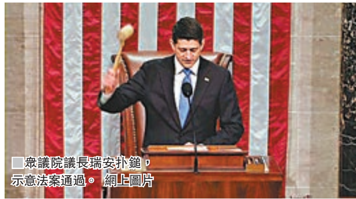
眾議院議長瑞安宣稱，示法案通過。網上圖片