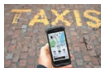
歐洲法院裁定Uber屬於運輸公司，而非數碼共乘平台。

電召車應用程式Uber遭受重大打擊，歐洲法院昨日裁定，Uber屬於單純運輸公司，而非公司所宣稱的數碼共乘平台，意味今後Uber在歐盟的運作將受到傳統的士業條例的嚴格監管，除了需要申領牌照，今後亦不可以將Uber司機視作共享平台的自僱人士，而必須將他們當作公司旗下司機，提供相關僱員福利。