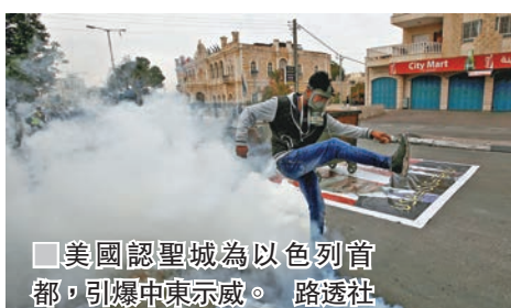
美國認聖城為以色列首都，引爆中東示威。

聯合國安理會關於耶路撒冷地位問題的決議草案遭美國一票否決後，聯合國大會於香港時間今晚再召開緊急會議，就類似決議草案進行表決，由於美國在聯大沒有否決權，預料草案很大機會獲得通過。美國常駐聯合國代表黑利表明，總統特朗普已經下令記下所有支持決議、反對美國承認耶路撒冷為以色列首都的國家的名字。