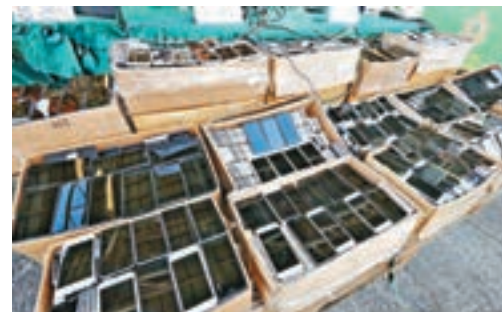
水警聯同海關截獲8,500部走私二手手機。

控方指，涉案酒家其他經營者，早前也接獲合共5張傳票，昨日今頭在九龍城、東區、屯門及沙田裁判法院提訊，均被票控同一控罪。被告包括中上投資有限公司、中雅實業有限公司、富泰創建有限公司及中康企業有限公司，分別以富臨漁港、富臨皇宮及富臨酒家名稱經營，被控於去年7月至今年3月，在沙田、屯門和旺角分店出售應用虛假標籤的粟米石斑塊。 辯方提出申請，盼能以「承諾」取代傳票檢控，裁判官最後決定將其他各區的5張傳票，跟前述的3張傳票合併，明年2月20日集中在西九龍裁判法院一併處理。