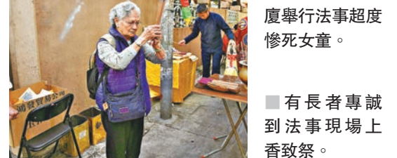
有長者專誠到法事現場上香致祭。