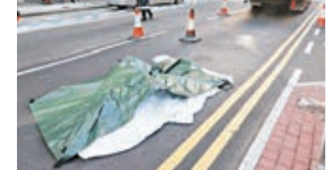
老嫗遭車輪輾過頭部，當場死亡。