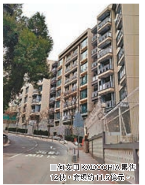
何文田KADOORIA累售12伙,套現約11.5億元。

香港文匯報訊(記者 梁悅琴)一手豪宅盤持續錄成交,中國海外於港島南區環角徑2號以2.4976億元售出屋苑最後一幢洋房第6號屋,洋房實用面積4,198方呎,呎價59,496元;據成交記錄顯示,買家可獲得11.75%折扣。環角徑2號由7幢洋房組成,自2015年初開售以來,全部7幢洋房清袋,套現逾18億元。 此外,中信泰富於何文田KADOORIA昨日亦透過招標形式售出嘉道理道119號5樓單位,實用面積1,672方呎,成交價7,620萬元,呎價45,574元。KADOORIA推售個多月來,最高呎價高近7萬元,為何文田分層物業最高紀錄。 天寰特色戶呎售3萬 建灝地產於啟德天寰昨以招標形式售出2伙特色戶。其中「星寰匯」第3座5、6樓及天台Sky Spa Villa A(複式)單位,實用面積1,518方呎,以4,683.8萬元售出,實用呎價約30,855元,成交價及呎價均創項目新高。另外,「星寰匯」第5座地下Garden Villa C單位,實用面積812方呎,則以2,273萬元成交,實用呎價約27,993元。截至昨晚6時半,該盤累沽762伙,套現約79.09億元,平均呎價約20,353元。