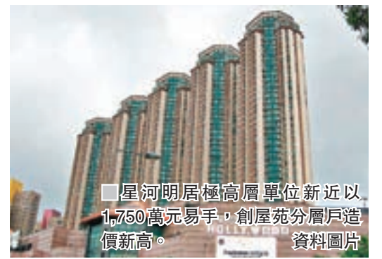
星河明居極高層單位新近以1,750萬元易手,創屋苑分層戶造價新高。 資料圖片

去年發生石棺藏屍案的荃灣工廈DAN 6,再添蝕讓成交。據土地註冊處資料顯示,該度低層B室,建築面積493方呎,新近以100萬元易手,折合呎價2,028元。原業主於去年8月以約270萬元購入,持貨僅一年多便易手,期內賬面蝕約170萬元或貶值63%。