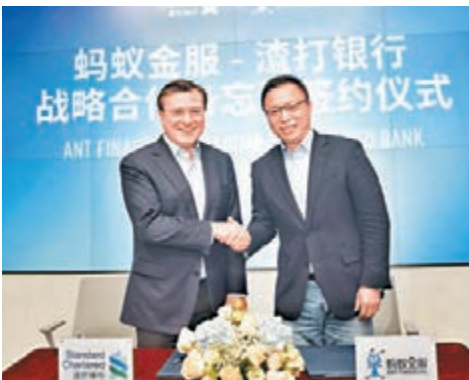
韋浩思（左）和井賢棟簽署合作備忘錄。

螞蟻金服首席執行官井賢棟亦期望能與渣打銀行加強合作，以「為世界帶來更多平等機會」為使命，螞蟻金服用科技使金融服務