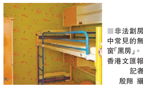
非法劏房中常見的無窗「黑房」。

進行動工禮的土瓜灣項目共有53個單位,全數由恒基兆業提供,當中29個單位由恒基兆業提供裝修,餘下24個單位由香港建造商會義助裝修。 目前共接獲的408個單位中,機構業主提供的有294個單位,個別小業主提供的單位有114個,當中已勘察的單位逾半,合適使用的單位超過100個,其餘單位由社聯職員陸續進行勘察工作。 社協又稱,由機構業主提供的單位包括恒基兆業提供的187個單位,已勘察118