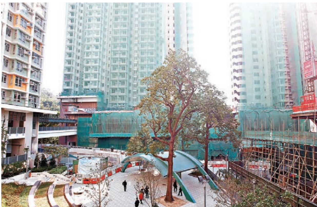
蘇屋邨將於明年中完成重建,提供近7,000個單位,可供約1.9萬人居住。