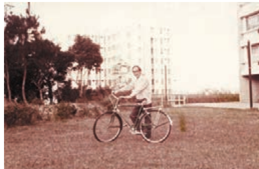
1970年代的余光中。選自《古堡與黑塔》，香港中華書局出版。

黃維樑曾編著《火浴的鳳凰：余光中作品評論集》、《璀璨的五采筆》與《壯麗、余光中論》等書，聽到余光中病逝的消息時，他人正在深圳。「有心理準備，」他聲音有些低沉，「昨天（12月14日）看報紙，說余先生住院療養了，我和余太太通了電話，告訴我余先生仍清醒着。本來今天，我要飛高雄去看余先生的，結果昨晚晚晚沒有睡着，早上，余先生的女兒微信來說情況有變化，中午（余先生）去世了。」今年六月，黃維樑還專門前往高雄看望余光中，10月份位於高雄的中山大學為余光中90歲生日作壽，並首播《余光中書寫香港紀錄片》，他也到了現場，「余先生身體一直比較弱，聲音也小，但沒有想過才過了沒有幾個星期……」