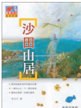
《沙田山居》，商務印書館（香港），2014年