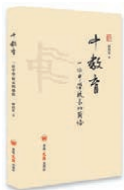
《中教育——位中學校長的感悟》作者：田寶宏 出版社：香港文匯出版社

中學教育，無論怎麼演繹，終歸都要落到實踐層面上。我們的教育若能時中，正中而執中，也許就能得中，我們的學校教育便可以做到恰如其分，適當其時，恰到好處。正如《禮記·中庸第三十一》所言：「喜怒哀樂之未發，謂