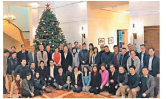
禮賓府聖誕樹前的大合照。

所以話，「熱城」成班都小家玻璃心，都唔知幾時踩親某個人條尾，俾佢咁當係「自己友」，都真係要喊三聲。