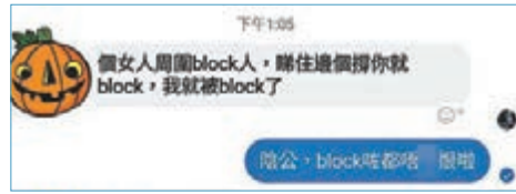
有「熱城」成員去阿姐處留言後表示被block。