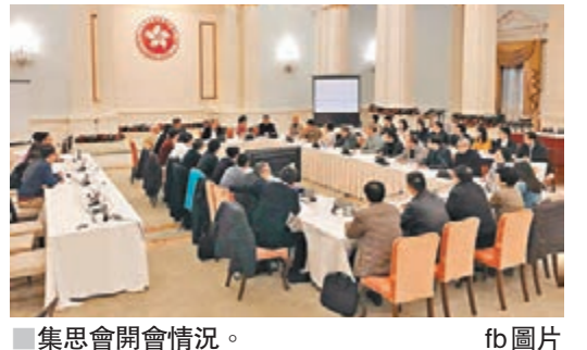
集思會開會情況。

林鄭月娥昨晚就在facebook上載兩張圖片，一張為在禮賓府聖誕樹前的大合照，另一張為開會情況。她表示昨日很齊人，除了兩名不在香港的局長外，四十多名政治委任官員齊齊出席，十多名政治助理更是首次參加，大家也在聖誕樹前拍照留念，分享節日氣氛。她更藉機預祝市民聖誕、新年快樂。