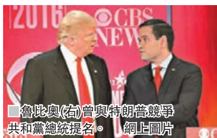
魯比奧(右)曾與特朗普競爭共和黨總統提名。