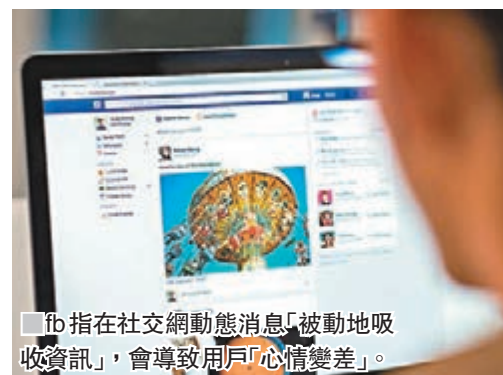
fb 指在社交網動態消息「被動地吸收資訊」，會導致用戶「心情變差」。現，有壓力學生選擇看fb的人數較後者多一倍。

在另一項研究當中，研究人員提供fb、影片分享網站YouTube、網上音樂和遊戲平台，給有學業壓力的學生選擇，哪個平台會讓他們感覺良好，並與沒壓力學生的選擇比較。結果發