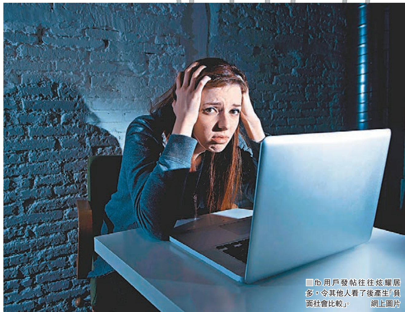
fb 用戶發帖往往炫耀居多，令其他人看了後產生「負面社會比較」。網上圖片