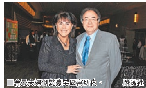
舍曼夫婦倒斃豪宅區寓所內。