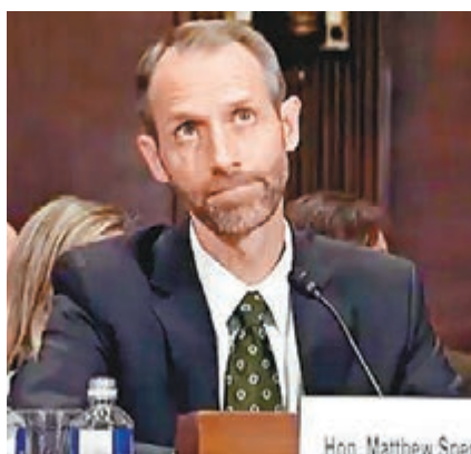
彼得森不斷擺出無奈表情。

彼得森一概回答「沒有」。肯尼迪再詢問彼得森是否曾為證人錄取供詞，彼得森答道受僱於律師事務所期間曾協助錄取證供，但已記不起有多少次。彼得森1999年在知名的弗吉尼亞大學法學院畢業，任職律師事務所，但沒有出庭經驗，2008年加入聯邦選舉委員會。他大出洋相的片段成為網民熱議對象，民主黨籍羅得島參議員懷特豪斯在twitter轉發片段時，還留言稱「一定要看」，指對方竟連一條基本法律問題也答不出。