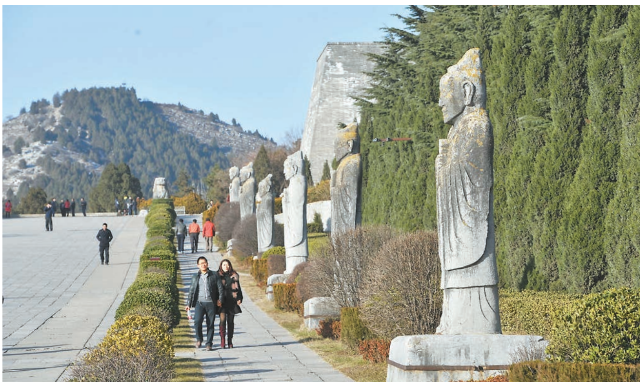
唐乾陵不僅是武則天和其夫唐高宗的合葬陵，更因歷經千百年卻從未被盜而成為傳奇。

根據考證，歷史上流傳的盜掘乾陵之事，只有五代時的溫韜有史可查，其它均無史料可考。當時溫韜盤踞關中，其餘十七唐帝陵悉數被其盜掘，唯有在盜挖乾陵時，屢次遭遇風雨雷電大作，溫韜認為這是李治與武則天的神靈在護佑，因而打消了盜墓的念頭。