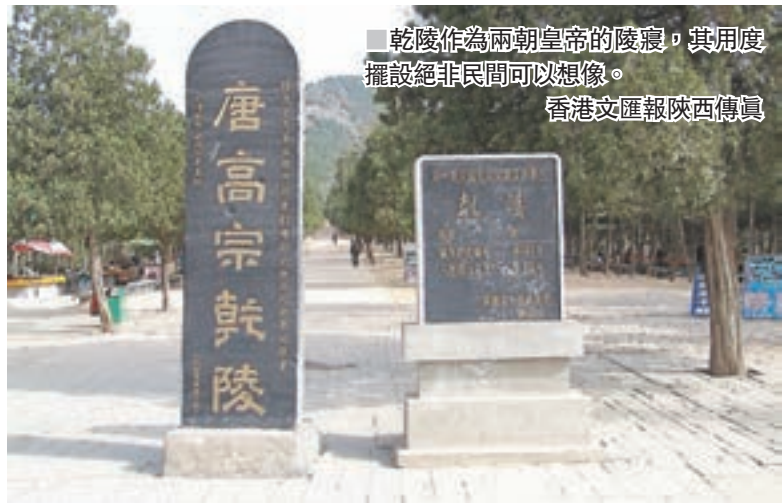
乾陵作為兩朝皇帝的陵寢，其用度擺設絕非民間可以想像。

一提起陝西，許多人或許都會聯想到那句經典的「關中厚土埋皇上」。13個王朝長達1,200多年的建都史，在創造盛世的同時，亦在號稱八百里秦川的關中平原上，星羅棋佈地留下了一座座猶如金字塔般的帝陵。而在這些帝陵中，尤以「因山為陵」的唐乾陵最為神秘和引人注目。它不僅是中國唯一女皇武則天和其夫高宗皇帝的合葬陵，埋藏的珍寶和秘密不計其數，更因歷經千百年從未被盜而成為傳奇。