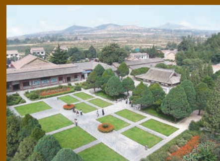
■永泰公主墓鳥瞰圖。

永泰公主墓墓室壁畫中的《宮女圖》最為精美，畫工將眾多的人物進行合理的組合，畫內宮女各持不同器具，且角度、形態各異，加上栩栩如生的神情，是表現宮廷生活的最為寫實的經典之作，備受國內外歷史界及藝術界的專家、學者稱讚。