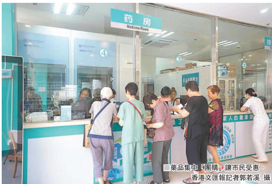
■藥品集中「團購」讓市民受惠。

而在近期，深圳市發改委、市衛計委和人社局將印發第二階段醫療服務價格改革的相關措施，預計治療、手術、診查、