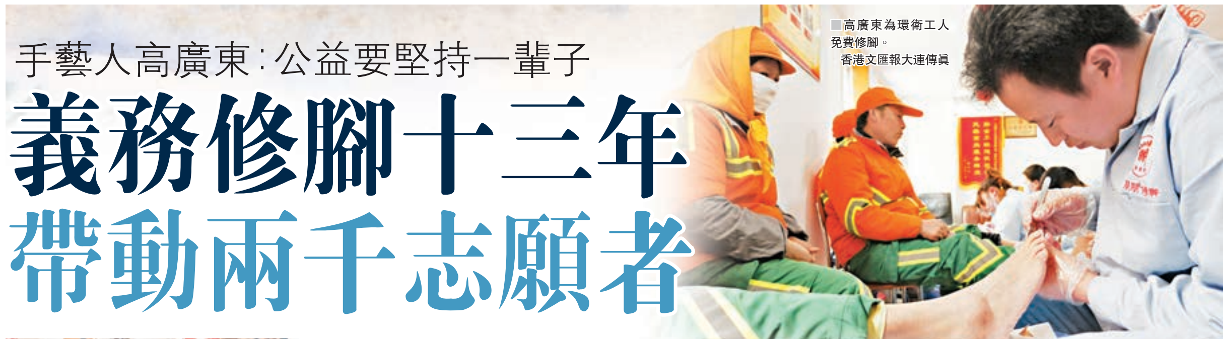
■高廣東為環衛工人免費修腳。