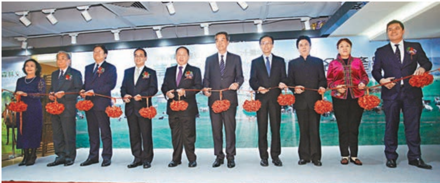
■裕華國貨《草原，森林文化——內蒙古名優產品展》，嘉賓主持剪綵儀式。