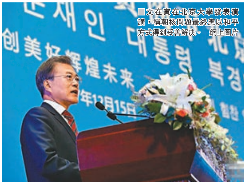
文在寅在北京大學發表演講，稱朝核問題最終應以和平方式得到妥善解決。

香港文匯報訊 據中通社報道，正在中國訪問的韓國總統文在寅昨日在北京大學發表演講，題為「韓中青年緊握手，共創繁榮明天」的演講，稱朝核問題最終應以和平方式得到妥善解決。這是韓國總統時隔9年再在北大發表演講。