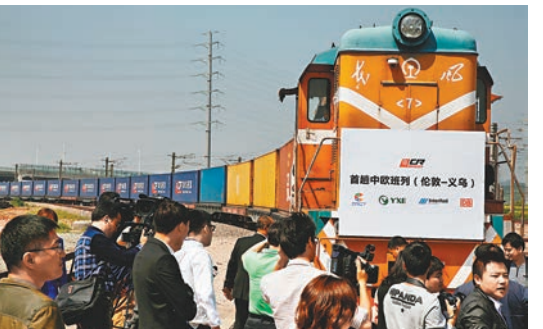
夏文達在對中國為期兩天的訪問之中，將與中國簽署價值10億英鎊的貿易和投資協議。圖為由中國義烏開抵英國倫敦的中歐班列。

香港文匯報訊 據新華網綜合報道，英國財政大臣夏文達在對中國為期兩天的訪問之中，將與這個亞洲國家簽署價值10億英鎊(約合104億港元)的貿易和投資協議。