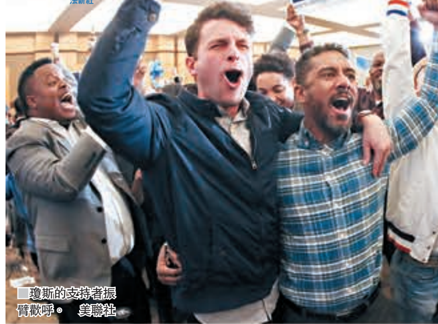
■瓊斯以些微差距勝出，為民主黨奪得亞拉巴馬州議席。

黑上票結果顯示，瓊斯獲得49.9%選票，比得票48.4%的穆爾多約2萬票。穆爾會見支持者時拒絕承認落敗，強調點票仍未結束，又引述州法例指如果兩人差距不足半個百分點的話會自動觸發重點。不過兩人得票差距是有關規定的3倍，亞拉巴馬州務卿梅里爾直言選舉結果不太可能改變，「亞拉巴馬人民已經發聲」。