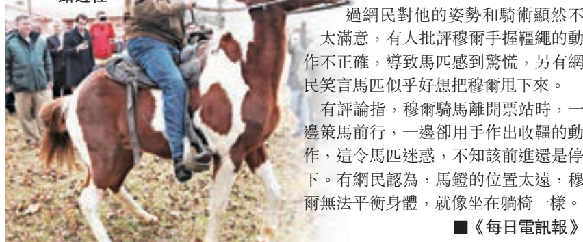
■穆爾騎馬離開票站。