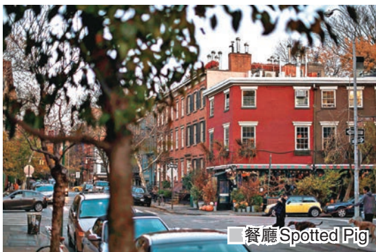
餐廳 Spotted Pig

《紐約時報》前日報道，紐約餐廳Spotted Pig名廚弗里德曼涉嫌性侵犯女下屬，甚至在餐廳內設置專門讓客人舉行性派對的房間，員工稱之為「強姦室」。弗里德曼就自己的行為道