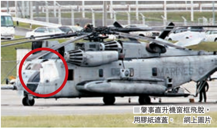
肇事直升機窗框飛脫，用膠紙遮蓋。網上圖片