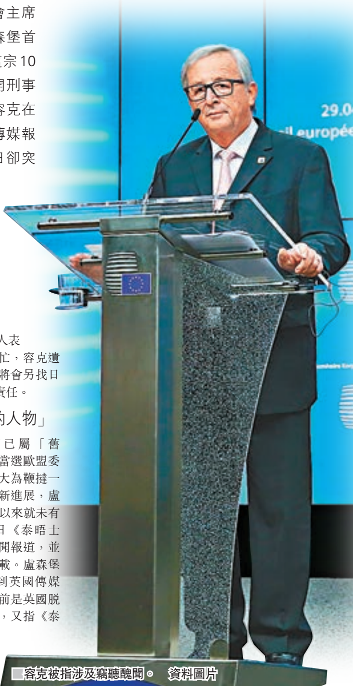
容克被指涉及竊聽醜聞。資料圖片