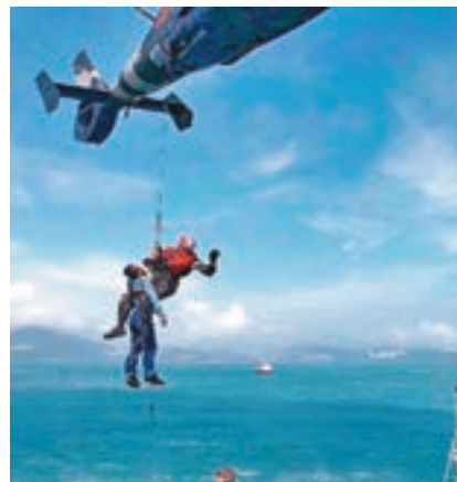
解放軍駐港部隊出動海空編隊參加香港海上空難搜救演練。