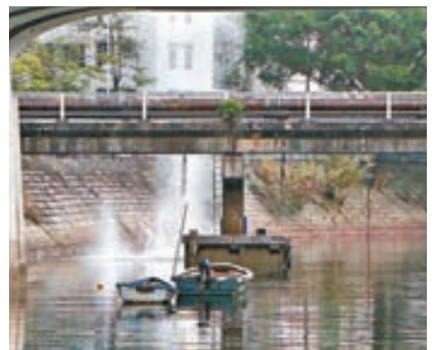
迫擊炮彈即場水中引爆，濺起近10米高水花。香港文匯報記者鄧偉明攝 河床有長約1呎多的疑似迫擊炮彈。 香港文匯報記者鄧偉明攝

香港文匯報訊(記者 鄧偉明、蕭景源)一枚約1呎長，屬美國製二戰時期的迫擊炮彈，昨被發現在馬鞍山梅子林路一條明渠內，警方接報需將現場約500米範圍臨時封閉，再由爆炸品處理課(EOD)人員到場調查，最終決定即場水中引爆，連聲巨響，濺起近10米高水花。