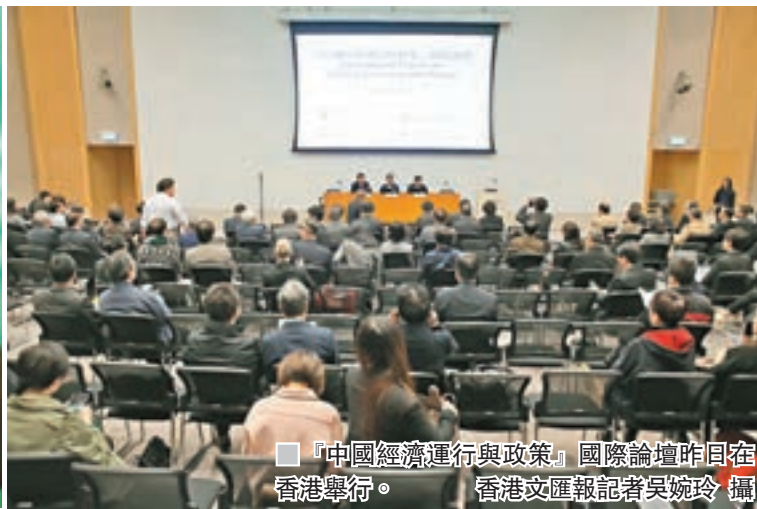
「中國經濟運行與政策」國際論壇昨日在香港舉行。