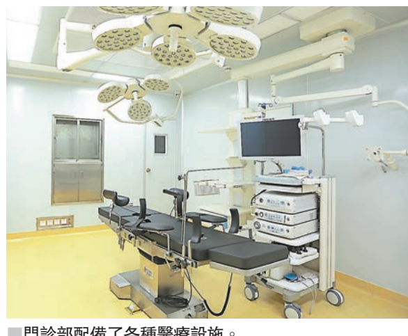
■門診部配備了各種醫療設施。