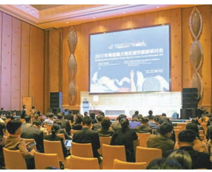
■與會嘉賓把脈大灣區世界級旅遊目的地建設。香港文匯報記者胡若璋 攝

香港文匯報訊（記者 胡若璋 珠海報道）廣東9個城市與香港、澳門的旅遊主管部門11日在珠海成立粵港澳大灣區城市旅遊聯合會，現場通過了《粵港澳大灣區城市旅遊聯合會章程》並簽署協定，並於12日舉行了聯合會成員大會。參與聯合會的廣東城市包括廣州、深圳、珠海、佛山、惠州、東莞、中山、江門和肇慶。 聯合會秉承「合作發展、品牌共創、市場共享」的理念，旨在通過密切聯繫、整合資源、聯合營銷、形成品牌等方式，深化粵港澳大灣區城市之間旅遊業的互動與合作，攜手打造大灣區世界級旅遊目的地。