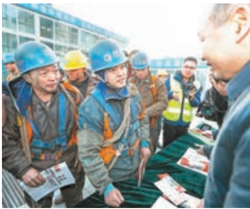
■今年12月1日，全國保障農民工工資支付宣傳活動在京啓動。資料圖片

《辦法》指出，考核結果分為A、B、C三個等級。考核結果作為對各省級政府領導班子和有關領導幹部進行綜合考核評價的參考；考核過程中發現需要問責的問題線索，移交紀檢監察機關。 《辦法》明確，對考核結果為A級的省級政府，由部際聯席會議予以通報表揚；對考核結果為C級的省級政府，由部際聯席會議對該省級政府有關負責人進行約談，責成其限期整改並提交書面報告。對在考核工作中弄虛作假、瞞報