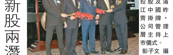
日清食品、守益控股及浦江中國昨齊掛牌, 公司管理層主持上市儀式。

香港文匯報訊(記者 張美婷)昨日港股造好升逾300點, 惟未有惠及新股市場, 昨日有3隻新股上市, 有兩隻「損手」。其中知名度最高的日清食品(1475)首日潛水約5%, 每手蝕約170元, 而蝕得最多即為守益控股(2227), 大跌近19%, 每手蝕640元。