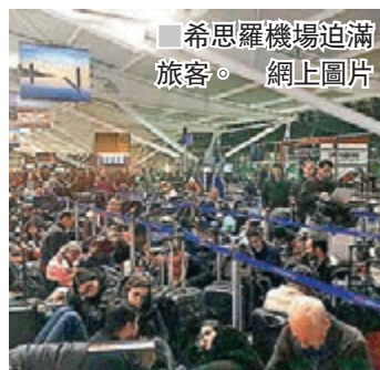
希思羅機場迫滿旅客。網上圖片

英國最大機場希思羅機場服務嚴重受阻，英國航空公司前日共取消140班短途和26班長途航班，昨再取消79班，兩日來合共6.5萬旅客受影響。德國航空樞紐法蘭克福機場由於跑道積雪，前日取消約330班航班。杜塞爾多夫機場前日亦一度關閉4小時。北萊茵-威斯特伐利亞州部分火車延誤甚至取消。