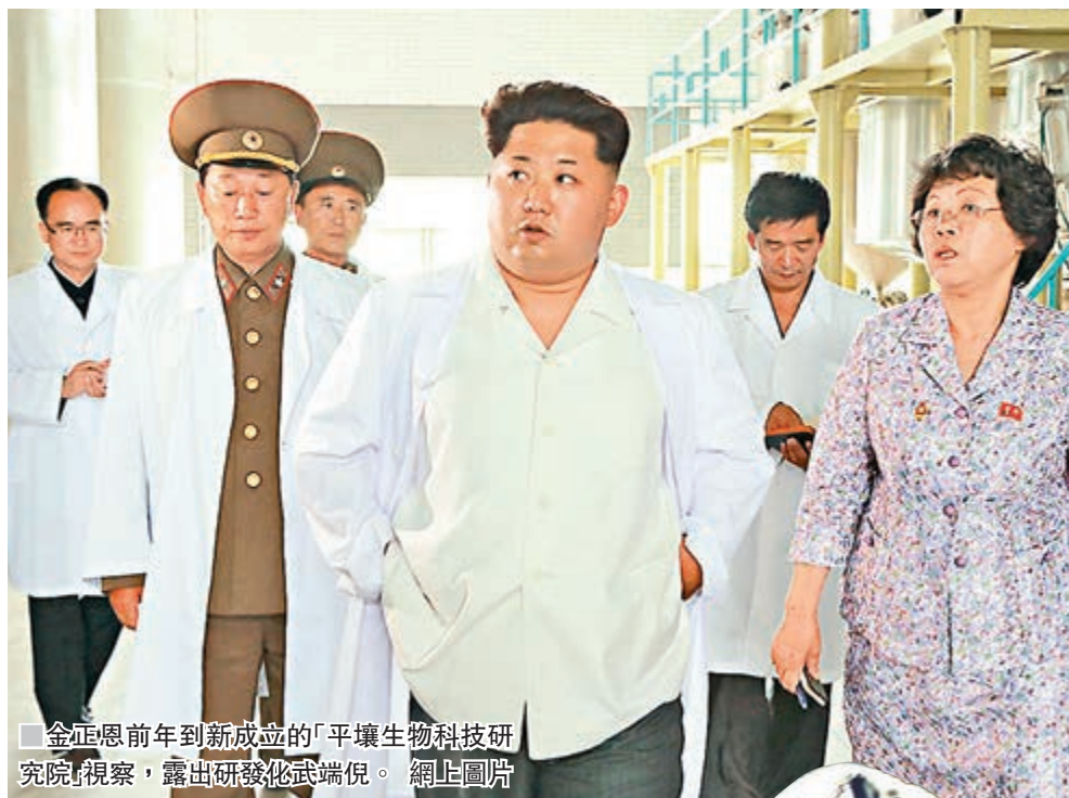
金正恩前年到新成立的「平壤生物科技研究院」視察，露出研發生化端倪。