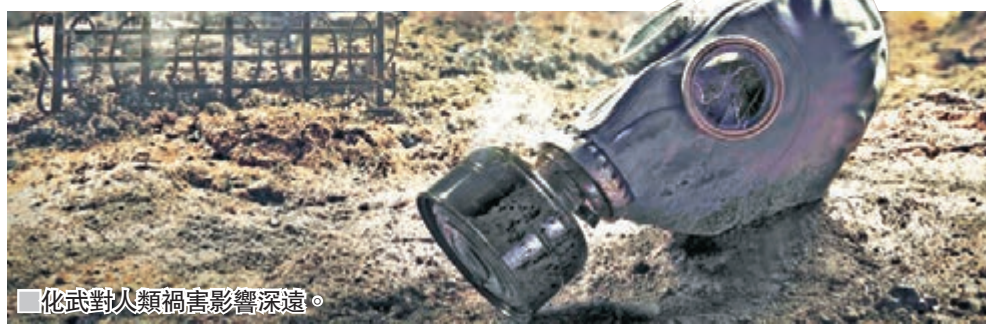
生化武器對人類禍害影響深遠。

早於冷戰年代，蘇聯科學家曾嘗試製造超級細菌，透過基因技術將不同的脫氧核糖核酸(DNA)拼接，增加細菌殺傷力，甚至加強細菌的「隱身」能力。美國分析家認為，雖然未有確實證據，但有跡象顯示朝鮮積極進行基因研究。