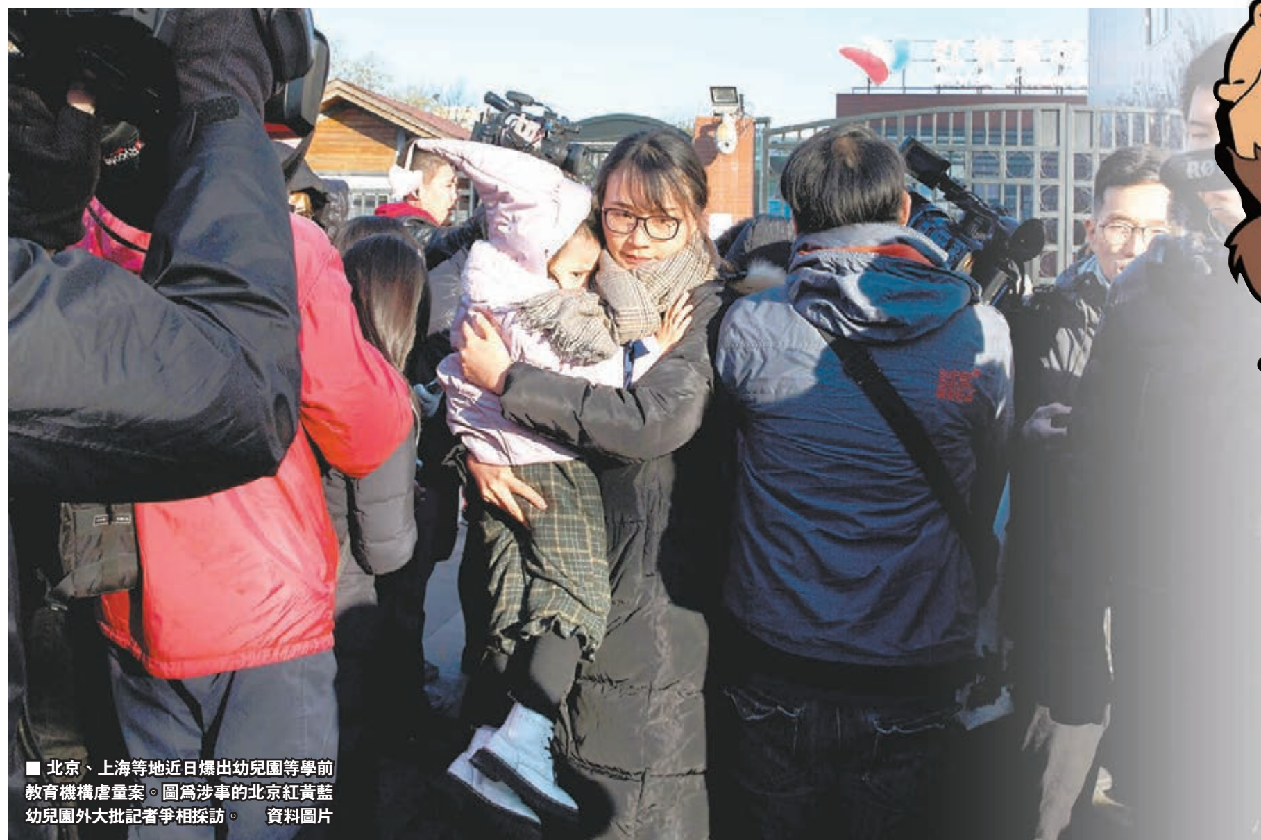
北京、上海等地近日曝出幼兒園等學前教育機構虐童案。圖為涉事的北京紅黃藍幼兒園外大批記者爭相採訪。資料圖片