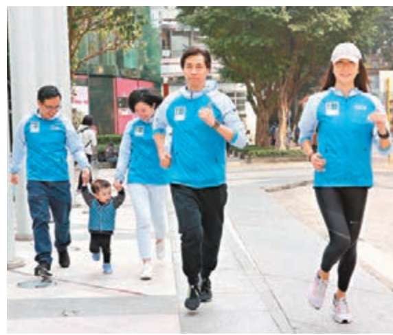
■多名跑手都指跑步雖然是個人運動，但亦可以拉近人與人之間距離。

香港文匯報訊（記者顏晉傑）不少香港人因為工作繁忙而欠缺運動，但多名將會參與「渣打馬拉松2018」的跑步愛好者都指出，運動對平衡工作與生活十分重要，認為抽時間做運動並不如想像中困難，稱只要有一雙運動鞋在任何時間都可以跑步，並表示跑步雖然只是個人運動，亦一樣可以拉近人與人之間的距離，令他們與家人、朋友和同事關係變得更緊密，亦可以改善身體健康，亦能協助他們投入工作、面對挑戰。