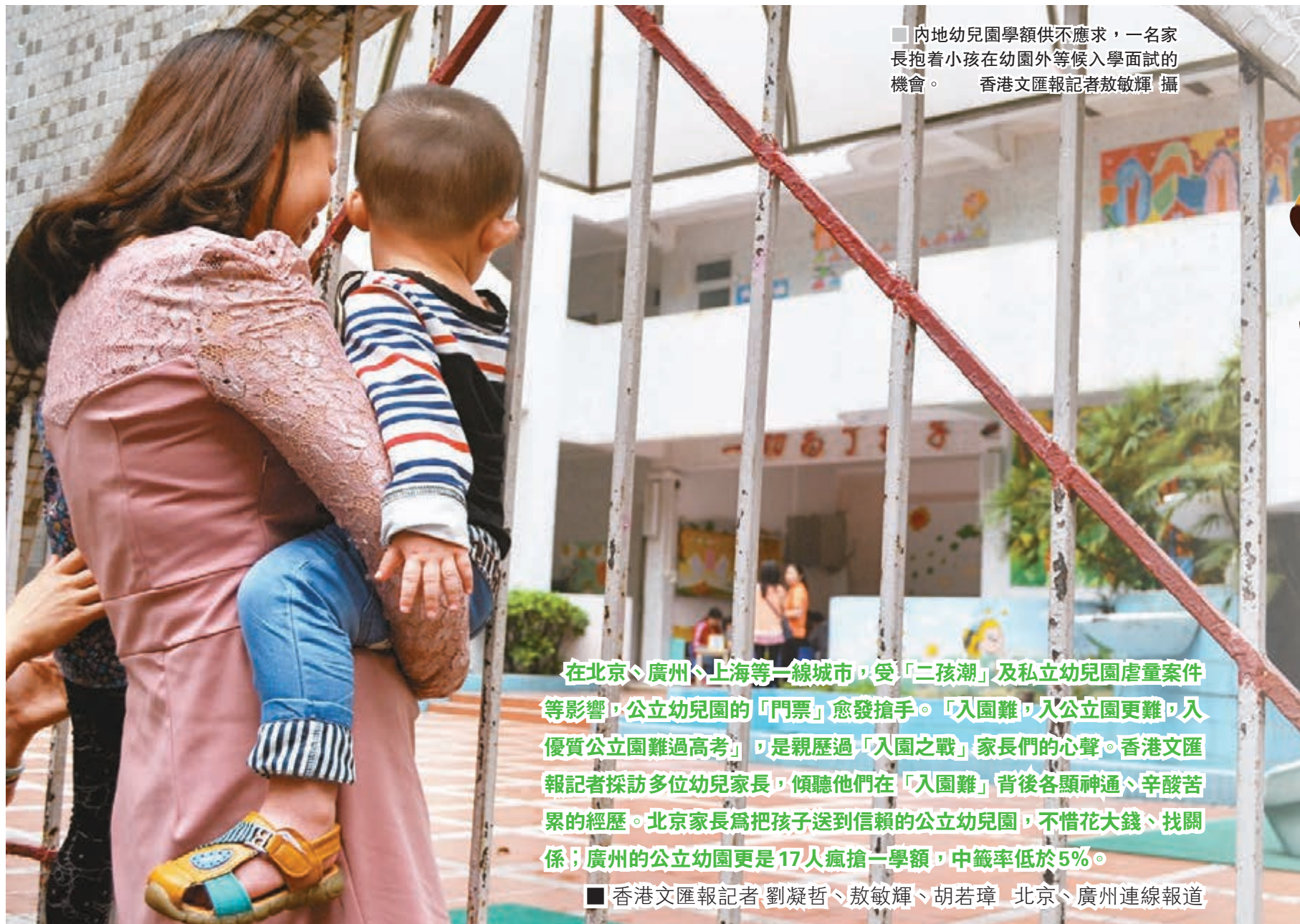
內地幼兒園學額供不應求，一名家長抱着小孩在幼兒園外等候入學面試的機會。

在北京、廣州、上海等一線城市，受「二孩潮」及私立幼兒園虐童案件等影響，公立幼兒園的「門票」愈發搶手。「入園難，入公立園更難，入優質公立園難過高考」，可是親歷過「入園之戰」家長們的心聲。香港文匯報記者採訪多位幼兒家長，傾聽他們在「入園難」背後各顯神通、辛苦苦累的經歷。北京家長為把孩子送到信賴的公立幼兒園，不惜花大錢、找關係；廣州的公立幼兒園更是17人瘋搶一學額，中籤率低於5%。