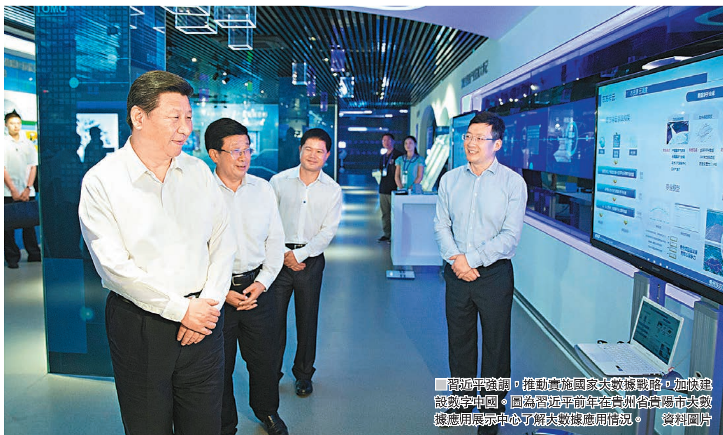
習近平強調，推動實施國家大數據戰略，加快建設數字中國。圖為習近平前年在貴州省貴陽市大數據應用展示中心了解大數據應用情況。

習近平指出，要構建以數據為關鍵要素的數字經濟。建設現代化經濟體系離不開大數據發展和應用。我們要堅持以供給側