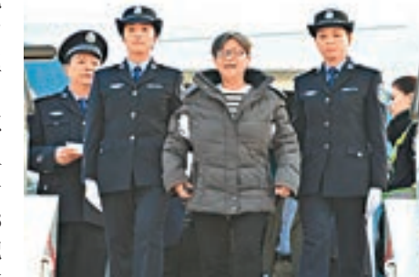
■潛逃海外的「百名紅通人員」頭號疑犯楊秀珠去年回國投案自首。資料圖片

至於另一「紅通」頭號疑犯楊秀珠認為，自己主動回國投案自首對其他外逃人員歸案具有引導意義，只要把贓款退一退，應該不至於吃牢飯。她還以為經過13年，許多證據都煙消雲散了，便不積極配合調查。浙江省追逃辦不斷擺事實、講道理，講政策、講法律，楊秀珠最終在法庭宣判時當庭認罪服法、不上訴。