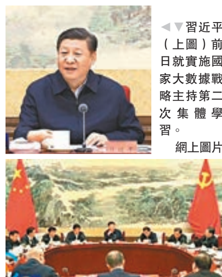
▲習近平（上圖）前日就實施國家大數據戰略主持第二次集體學習。

習近平指出，善於獲取數據、分析數據、運用數據，是領導幹部做好工作的基本功。各級領導幹部要加強學習，懂得大數據，用好大數據，增強利用數據推進各項工作的本領，不斷提高對大數據發展規律的把握能力，使大數據在各項工作中發揮更大作用。