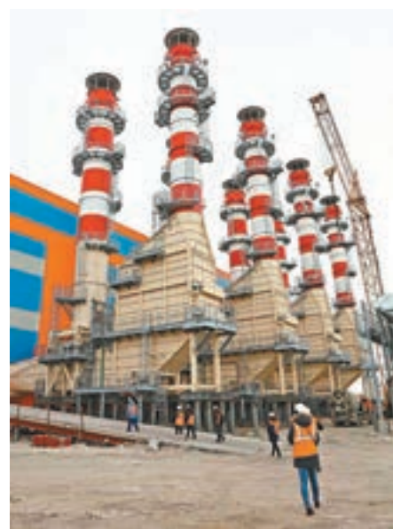
■中俄能源合作重大項目——亞馬爾液化天然氣項目第一條液化天然氣（LNG）生產線已正式投產。圖為位於北極圈內的亞馬爾液化天然氣項目現場。資料圖片

香港文匯報訊 據新華社報道，中俄能源合作重大項目——亞馬爾液化天然氣項目第一條液化天然氣（LNG）生產線已正式投產。亞馬爾項目是全球最大的北極LNG項目，也是「一帶一路」倡議提出後實施的首個海外特大型項目，對中國海外能源合作、提升中國在世界能源市場話語權具有重要意義。中國石油全價值鏈參與該項目運作，與絲路基金、俄羅斯諾瓦泰克公司、法國道達爾公司分別持有該項目20%、9.9%、50.1%、20%股份。