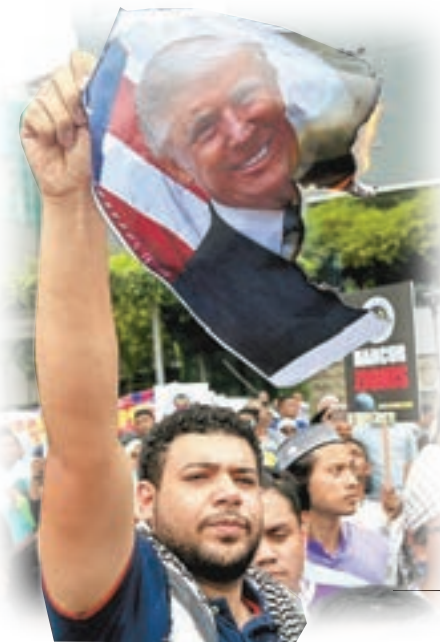
馬來西亞 燒特朗普照片