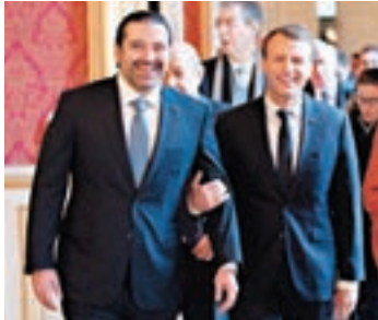
哈里里（左）與馬克龍

黎巴嫩在2012年宣佈實行「分離政策」，避免介入敘利亞內戰等地區衝突，但真主黨仍派遣數千人前往敘利亞，協助敘利亞總統巴沙爾作戰。一名法國外交官表示，與會各方將重申支持「分離政策」。 ■法新社/路透社