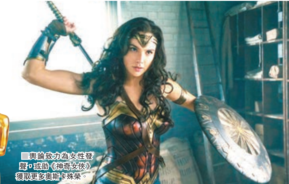
■輿論致力為女性發聲，或助《神奇女俠》獲取更多奧斯卡殊榮。