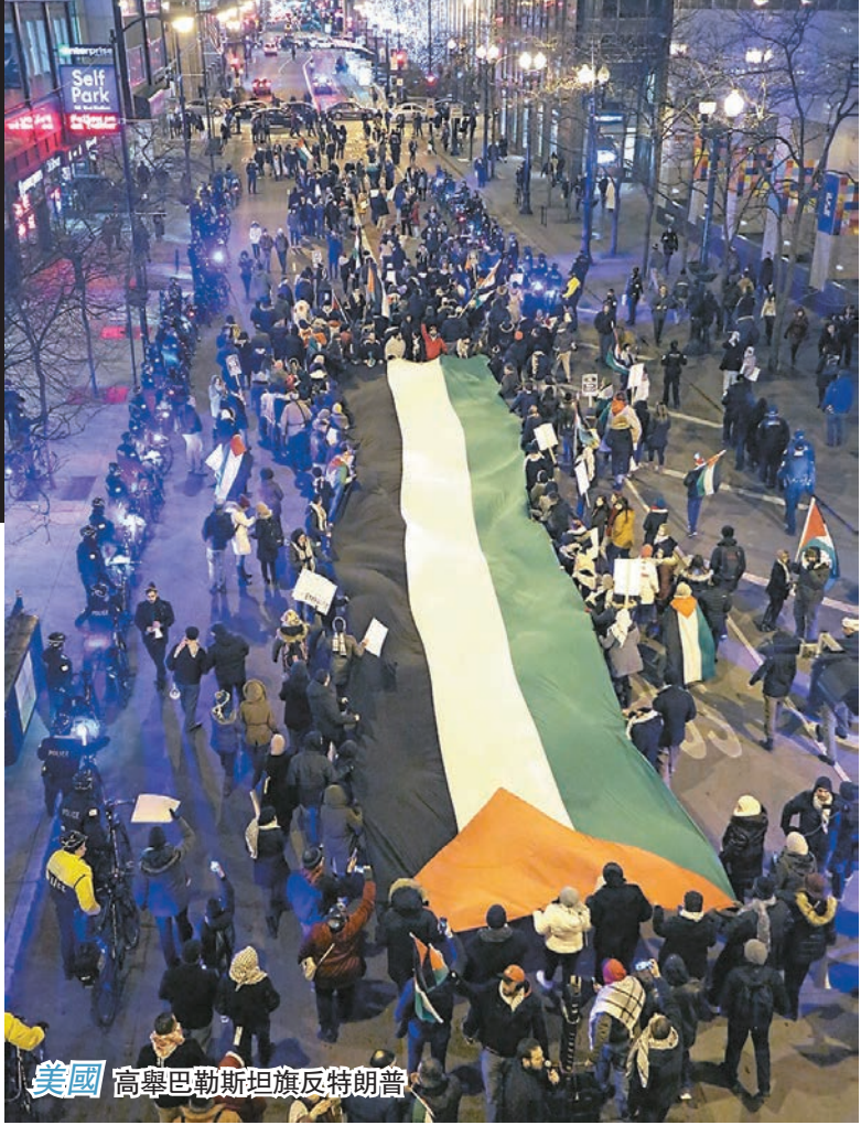
美國 高舉巴勒斯坦旗反特朗普