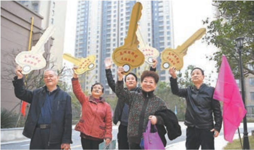
■此次政治局會議提出明年將加快住房制度改革和長效機制建設。圖為近日安徽合肥老舊小區升級後，分得新居的回遷住戶舉起鎖匙模型慶祝。