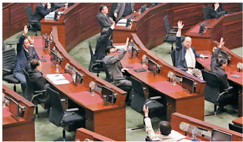
去年高鐵工程追加撥款立法會財委會投票表決現場。

46%受訪者認為「一地兩檢」方案符合基本法，25.8%受訪者認為不符合；同時，53.3%受訪者認為「一地兩檢」並無破壞「一國兩制」，33.4%受訪者持相反意見。