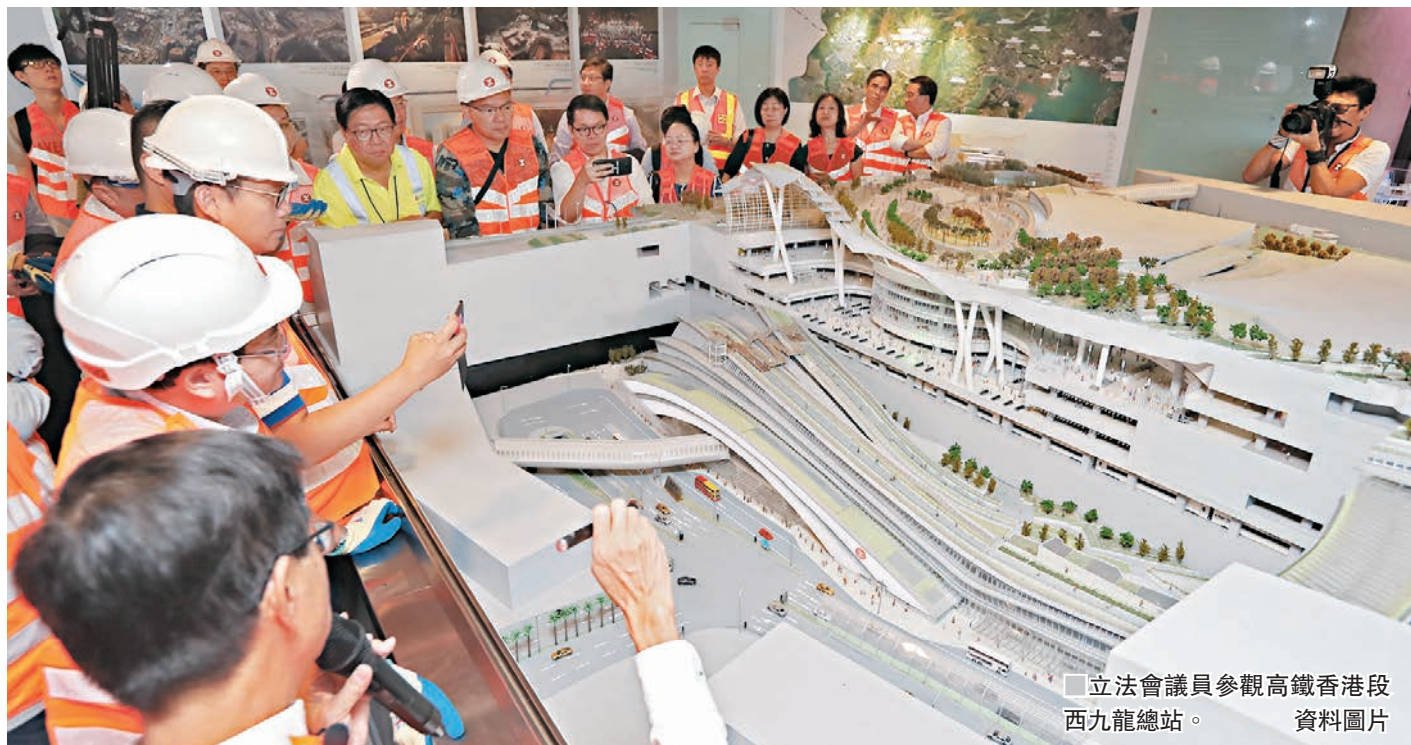
立法會議員參觀高鐵香港段西九龍總站。資料圖片

早前，高鐵香港段「一地兩檢」方案甫出，香港社會各界即討論得熱烘烘。很多聲音認為，「一地兩檢」對香港的短、長期發展均帶來巨大的好處。另一方面，有些聲音質疑，這個方案可能會影響「一國兩制」的落實。 ■張揚 特約通識作者