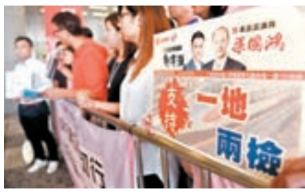
工聯會支持「一地兩檢」。資料圖片

內地遊客 ：高鐵開通不僅方便香港市民前往各地旅遊，同時「一地兩檢」措施亦為內地與香港居民在通關上帶來便利，有助內地市民更方便由各地前來香港旅遊，促進香港消費，有助香港經濟增長。