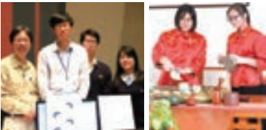
■師生以課室溫度調節系統榮獲金獎