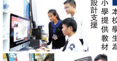
■STEM實驗計 ■融合視覺藝術與設計支援