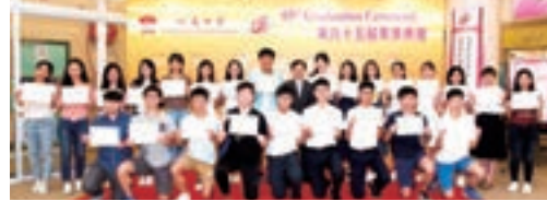
■吳校長與2017年文憑試優異生合照