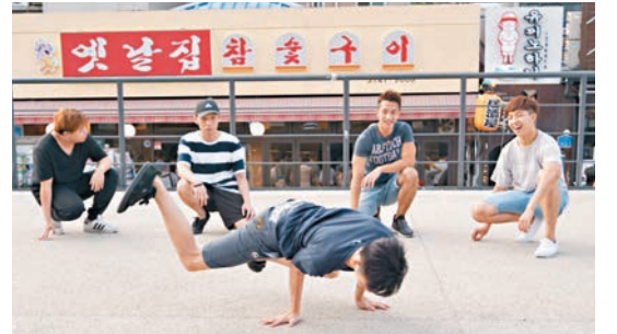
年輕人在旅程中進行街頭表演。

「韓行出狀元」結束以後,年輕人在「賽後檢討」中均有正面回應,一班陌生人在不足一週後能成為朋友,大概不只帶着友愛,還包括個人的成