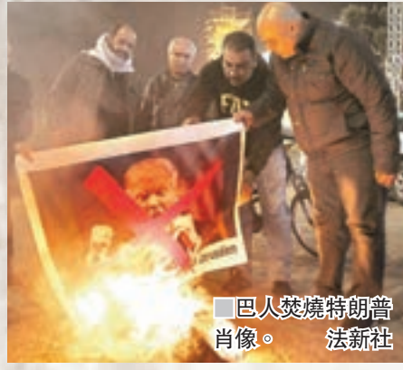
■ 巴人焚燒特朗普肖像。

美國白宮表示，總統特朗普定於昨日正式宣佈，承認「聖城」耶路撒冷為以色列首都，並會將美國駐以色列大使館由特拉維夫遷往耶路撒冷。消息觸發巴勒斯坦民眾怒火，控制約旦河西岸的巴勒斯坦法塔赫運動，昨日發起持續3天的「憤怒日」示威。美國國務院發出安全警報，表示鑑於可能發生大規模示威，因此禁止美國政府僱員及家屬前往耶路撒冷舊城區和西岸，直至另行通知。國際社會警告美方勿踩耶路撒冷這條「紅線」，土耳其總統埃爾多安形容，美國正將中東和全球捲入「一望無盡的戰火」。