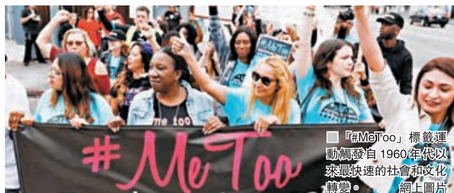
■ #MeToo標籤運動觸發自1960年代以來最快速的社會和文化轉變。