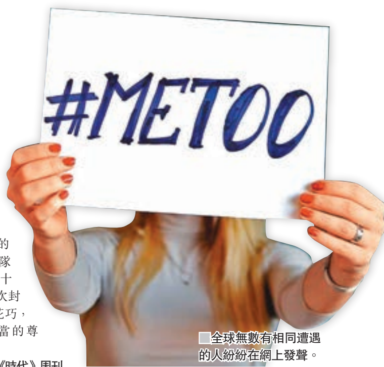
■ 全球無數有相同遭遇的人紛紛在網上發聲。