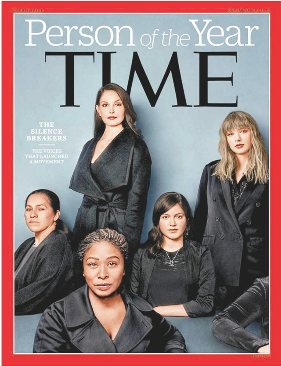
■ 「打破沉默者」登上《時代》特別版封面，右一為美國樂壇天后Taylor Swift。

《時代》總編輯費爾森塔爾昨日特意選擇在美國全國廣播公司(NBC)時事節目《Today》，公佈年度風雲人物得主，原因是該節目資深主持勞爾，最近因性騷擾醜聞被辭退。《Today》現任主持古斯里亦承認，今年風雲人物得主「近在咫尺」。