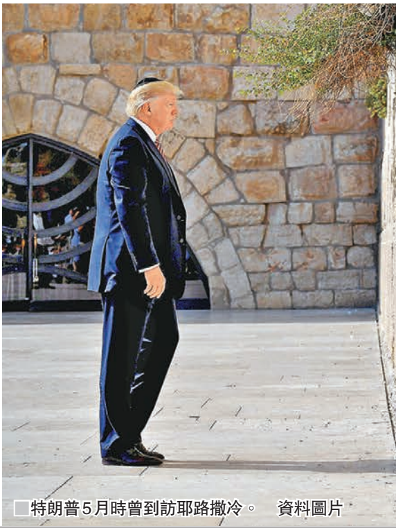
■ 特朗普5月時曾到訪耶路撒冷。 資料圖片

美國白宮表示，總統特朗普定於昨日正式宣佈，承認「聖城」耶路撒冷為以色列首都，並會將美國駐以色列大使館由特拉維夫遷往耶路撒冷。消息觸發巴勒斯坦民眾怒火，控制約旦河西岸的巴勒斯坦法塔赫運動，昨日發起持續3天的「憤怒日」示威。美國國務院發出安全警報，表示鑑於可能發生大規模示威，因此禁止美國政府僱員及家屬前往耶路撒冷舊城區和西岸，直至另行通知。國際社會警告美方勿踩耶路撒冷這條「紅線」，土耳其總統埃爾多安形容，美國正將中東和全球捲入「一望無盡的戰火」。