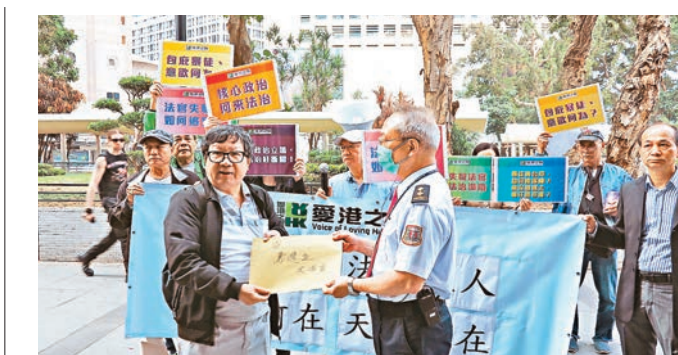
「愛港之聲」到終審法院請願。

不久已證實死亡。現場大廈則有約40名住客,包括部分長者及推着嬰兒車的女街坊要疏散到樓下暫避。