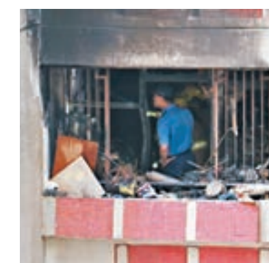
消防員進入被火燒毀的單位視察。

年說話不清,與人溝通均以筆代口。另陳在港沒有親人,但有女兒及孫居住廣州,親人亦不時來港探望他。 至於平日,陳喜歡執拾雜物回家,每次經過垃圾房都要入內「尋寶」,結果家中雜物堆積如山,其中放在碌架床上層的雜物已堆至天花板,幸平日他亦注重屋內清潔,未致傳出異味及惹來大量蟲鼠。另有街坊指,數年前,陳因家中煲燉食物失火,幸及時由消防員救出無受傷。 昨午1時5分,有街坊赫然發現上址單位窗口冒出大量濃煙,未幾全屋火光熊熊,陷入一片火海,濃煙直捲半空。消防員到場立即動用一條滅火喉及一隊煙帽隊灌救,下午1時24分將火救熄,惟單位已嚴重焚毀,對上一