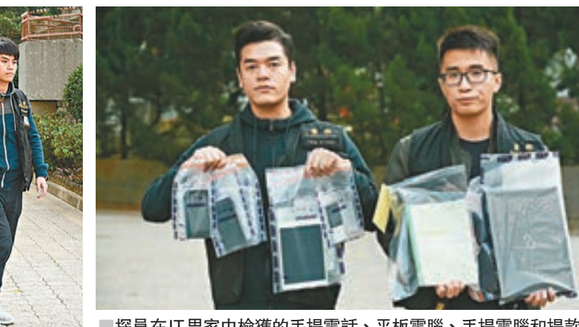
探員在IT男家中搜獲的手提電話、平板電腦、手提電腦和提款卡證物。

沙田警區刑事調查隊主管王頌然督察表示,在接獲有關騙案報告後,即聯同網絡安全及科技罪案調查科展開深入調查,證實至9月為止,共有24名受害人共將約7萬元款項存入同一個本地銀行戶口。