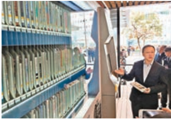
■ 屏幕顯示圖書目錄在上。 ■ 市民可以使用圖書證或者智能身份證借書及還書。