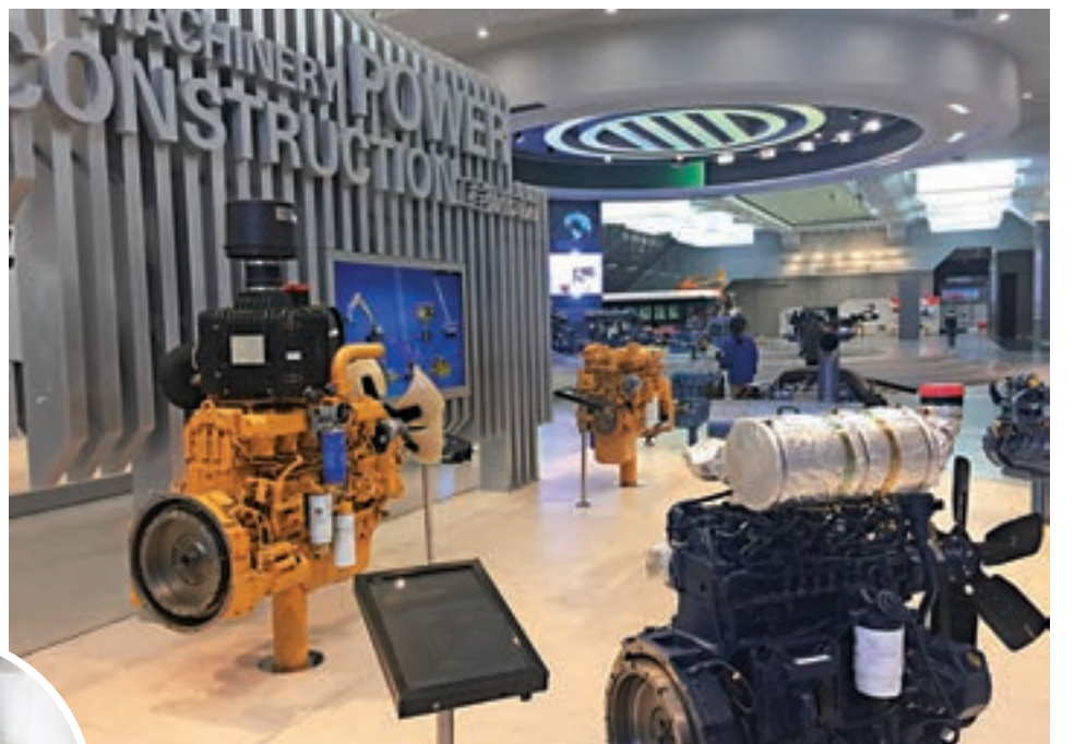
■濰柴集團展廳