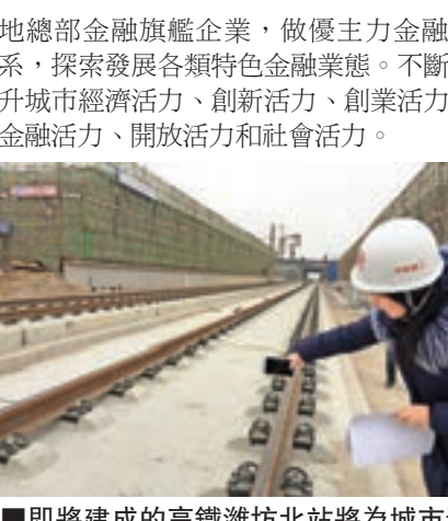
■即將建成的高鐵濰坊北站將為城市發展加速

根據規劃,未來三年濰坊將加快新舊動能轉換,培植壯大高新技術產業規模,構建以市場為導向、企業為主體、國際化產學研相結合的技術創新體系。同時打造本