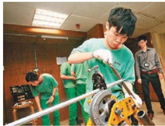
港鐵學徒培訓情形。資料圖片