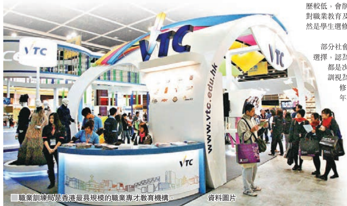
職業訓練局是香港最具規模的職業專才教育機構。資料圖片

建議政府把香港的「職業教育及培訓」重塑為「職業專才教育」，當中包括達至學位程度，而當中有很大比重為職業技能或專業知識的專門內容的課程。