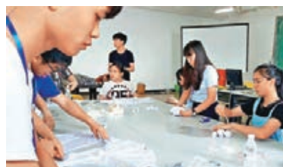
香港中學生到內地認識職業教育的活動，在課堂上嘗試紮染。資料圖片

政府應設立一站式的職業專才教育網站平台，提供職業專才教育及相關職業的資訊，讓老師、家長及學生能夠輕易搜尋所需要的資料。