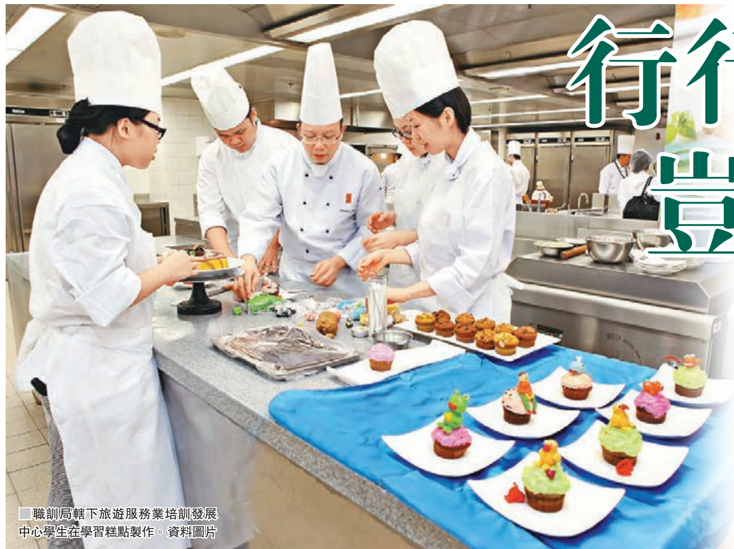
職訓局轄下旅遊服務業培訓發展中心學生在學習糕點製作。