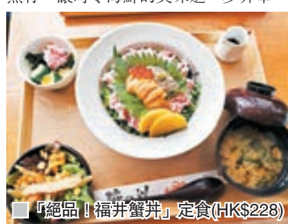
「絕品！福井蟹丼」定食(HK$228)

為了提升味道層次，「滝の川」特地為丼物炮製香濃蟹味噌及秘製醬汁，先把秘製醬汁倒進白飯，再以紅楚蟹肉配「滝の川」特製香濃蟹味噌，帶來與別不同的味覺享受。三色版「絕品！福井蟹丼」於飯面鋪上紅楚蟹肉及蟹味噌，配以豐腴的馬糞海膽及爽脆的三文魚籽，讓時令海鮮的美味進一步昇華。