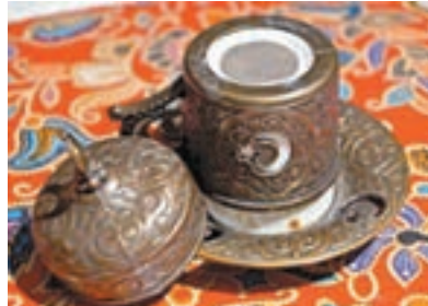
飽後，還能將客人多留一會兒，因此就發明，在喝完飯後咖啡的咖啡渣，藉機可以閒聊、談八卦，而從此就出現，以咖啡殘渣，預言吉凶的藝術。

另外，有一種說法則是，因為土耳其人，是較好客與熱情的民族，對於來客，莫不熱情招待，而為了能在酒足飯飽後，還能將客人多留一會兒，因此就發明，在喝完飯後咖啡的咖啡渣，藉機可以閒聊、談八卦，而從此就出現，以咖啡殘渣，預言吉凶的藝術。