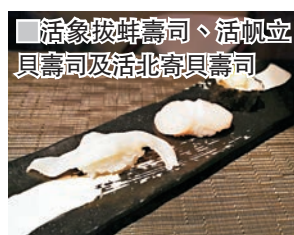
活象拔蚌壽司、活帆立貝壽司及活北寄貝壽司