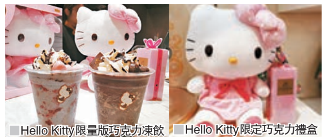
Hello Kitty限量版巧克力凍飲 Hello Kitty限定巧克力禮盒

早前，GODIVA在Hello Kitty生日當天於香港推出Hello Kitty 限定巧克力禮盒 (HK$499)，精緻甜蜜的GODIVA巧克力伴着甜美可人的Hello Kitty公仔。除了限量巧克力禮盒外，品牌更推出Hello Kitty 2017限量版巧克力凍飲，襯托着可愛Hello Kitty蝴蝶結造型的草莓巧克力或牛奶巧克力裝飾。