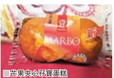
芒果夾心仔寶蛋糕

嘉頓仔寶蛋糕系列一直深受香港人歡迎，口味獨特創新，為不少人的早餐及下午茶點首選，最近更推出全新「芒果夾心仔寶蛋糕」，香甜的芒果蛋糕配上真材實料的鮮芒果忌廉夾心，雙重口感，味道濃郁。其忌廉香濃幼滑，更加入新鮮芒果肉製作，啖啖充滿芒果香味。每包均有2件小巧精緻的杯裝蛋糕，讓你可以隨時與家人、朋友分享，嘴饞的話亦可獨享滋味。