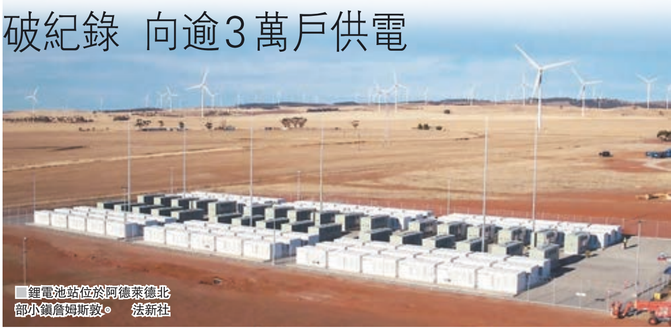
■ 鋰電池站位於阿德萊德北部小鎮詹姆士敦。

電動車巨企Tesla今年7月與法國可再生能源公司Neoen合作，在澳洲南澳省興建全球最大鋰電池蓄電系統，Tesla創辦人馬斯克當時聲稱，若無法在100日內完成項目，將不會收取供電費，最終趕及在限期前落成，昨日正式啟用，在即將進入夏季電力需求高峰期時，可向逾3萬戶家庭供電。