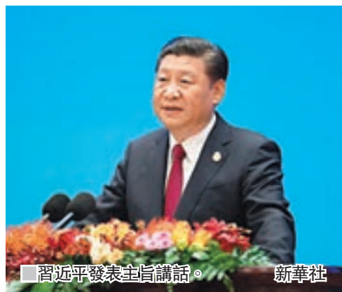
■習近平發表主旨講話。

開幕式後，高層對話會舉行第一次全體會議。柬埔寨人民黨主席、政府首相洪森，緬甸國務資政昂山素姬，俄羅斯統一俄羅斯黨總委員會主席團副書記熱列茲尼亞克，美國共和黨全國委員會庫安東尼·帕克，埃塞俄比亞人民革命民主陣線副主席、政府副總理德梅克在全體會議上分別致辭，高度評價習近平關於構建人類命運共同體、攜手建設更加美好世界的主張，表示願與中國共產黨一道，共同建設持久和平、普遍安全、共同繁榮、開放包容、清潔美麗的世界。