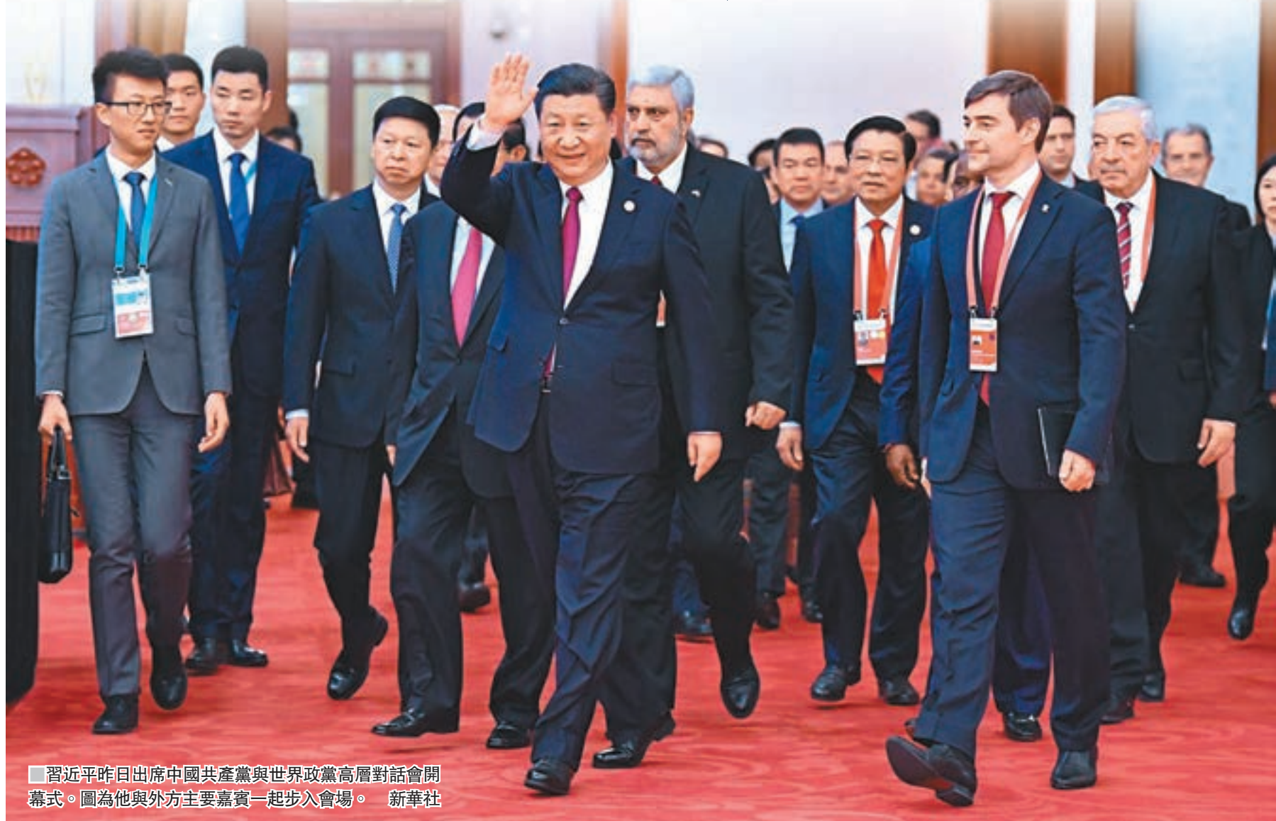
■習近平昨日出席中國共產黨與世界政黨高層對話會開幕式。圖為他與外方主要嘉賓一起步入會場。