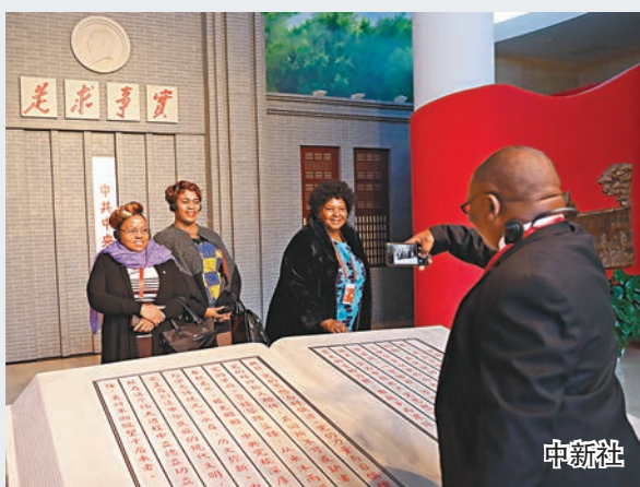
來華出席中國共產黨與世界政黨高層對話會的部分外國政黨領導人昨日參觀中共中央黨校(上圖)和「砥礪奮進的五年」大型成就展(下圖)。