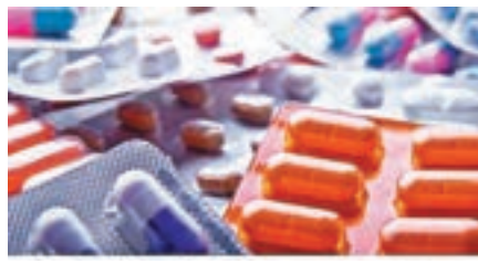
美國今年新藥審批加快。

此外，美聯儲局年底升息趨勢已大致定底，預期2018年尚有升息三次的空間，劉大平表示，升息循環將帶動金融業利潤提升，加上美國金融監管法規的鬆綁，資產累積業將直接受惠，也是助銀髮商機產業表現的新動力。