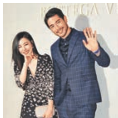
■高以翔（右）表示跟Tiffany是初次見面。

香港文匯報訊（記者李慶全）韓團少女時代前成員黃美英（Tiffany）、台灣型男高以翔、名人鄧愛嘉及黃愷傑等昨晚出席一個生活品牌的旗艦店開幕禮，Tiffany穿黑色低胸碎花裙出場時獲現場300名粉絲齊聲歡呼，她跟高以翔打招呼合照亦表現親切。之後到她獨自給傳媒拍照時，笑容燦爛之餘又向粉絲揮手鞠躬，非常識做。