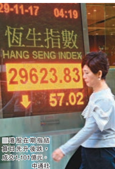
■ 港股在期指結算日先升後跌,成交1,101億元。中通社

香港文匯報訊(記者 周紹基)港股在期指結算日,碰着朝鮮再射導彈,令恒指先升後跌,高低波幅逾260點。騰訊(0700)及平保(2318)等熱炒股均下跌,令恒指最多跌過117點,10天線一度失守,全日收報29,623點,跌57點,是連續第三日下跌。大市成交1,101億元,是連續18日逾千億。