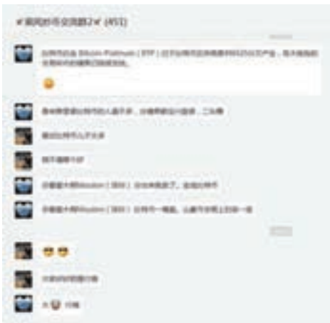
由於比特幣暴漲突破1萬美元,許多新比特幣衍生產品出來,內地投資者擔憂影響收益。香港文匯報深圳傳真

或在2018年底達4萬美元。有業內專家表示,如果對比特幣價格突破每隔節點做一個統計,可以發現其價格突破2,000美元大關之後,往後每到達一個新的高位,所花的時間幾乎都在縮短。