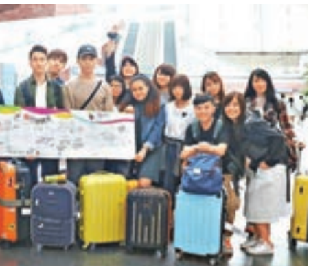
「韓行出狀元」計劃,讓年輕人在旅行時找到長處。

如果各位年輕人希望對工作世界及對自己有多些認識,可參與女青生涯規劃服務隊(香港島及離島)的工作體驗及實習計劃,詳情將於facebook ( https://www.facebook.com/hkywcaclap ) 內刊登,大家快點報名參與啦。