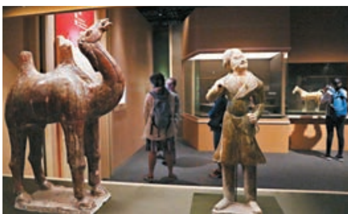
不少市民昨日到歷史博物館參觀。