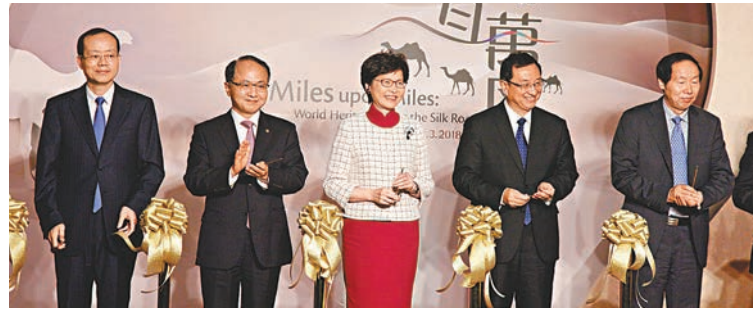
維樹剛(右二)前日出席「綿互萬里——世界遺產絲綢之路」開幕典禮。王志民(左二)於27日在中聯辦會見維樹剛。資料圖片

工作的支持，雙方就進一步加強兩地文化交流，特別是粵港澳大灣區文化交流合作等方面交換了意見。中聯辦副主任楊健參加會見。