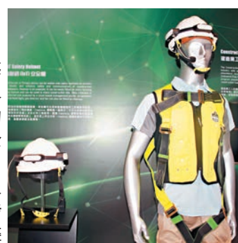
能即時感應建築工人身體狀況的物聯網安全帽。