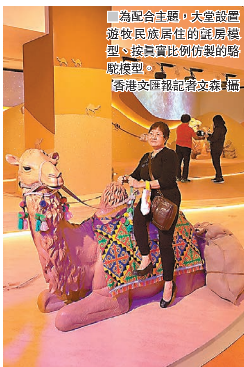
為配合主題，大堂設置遊牧民族居住的氈房模型、按真實比例仿製的駱駝模型。