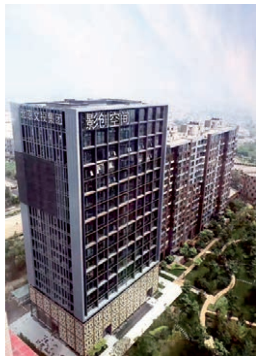
■北京文投集團影創空間

2017年，北京專門成立了全國文化中心建設領導小組，市委書記蔡奇任組長，市委副書記、代市長陳吉寧任第一副組長。在之前的2016年，北京正式發佈實施《「十三五」時期加強全國文化中心建設規劃》，首次將加強全國文化中心建設規劃列為市級重點專項規劃。