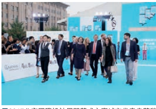
■2017北京國際設計周開幕式主賓城市代表走藍毯

北京加快推進國家對外文化貿易基地(北京)建設，支持文化企業開展對外文化貿易業務、協調組織圖書出版、廣播影視、動漫網遊等文化企業開拓國際市場，努力培育一批具有國際競爭力的外向型文化企業和中介機構，不斷壯大對外文化貿易的主力軍。同時，北京充分發揮國際性展會平台的作用推進對外文化貿易的發展，利用中國(北京)國際服務貿易交易會、北京國際設計周、北京國際電影節、北京國際圖書節等大型交易平臺建設，進一步提升平台的交易服務功能，促進創意、人才、項目、資本對接，加強國家間文化互動、項目合作和貿易往來。一系列活動和平台的搭建，為文化企業發展帶來了強大支持。