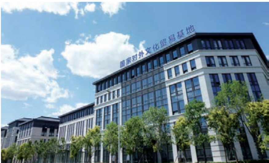
■國家對外文化貿易基地

11月28日，第21屆京港會在香港開幕。在15個大項活動中，文化創意產業板塊無疑是重頭戲之一。本屆京港會文化創意產業專題活動將於11月29日全港會展中心舉辦，活動的主題聚焦「擁抱機遇，合作共贏——讓傳統文化擁抱市場」。