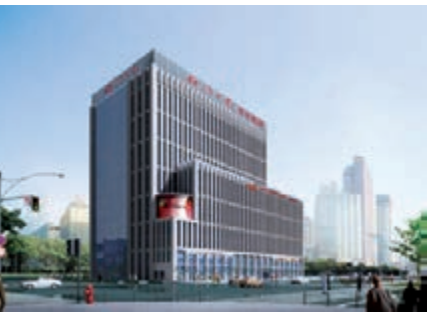
■北京文化創新工場首都文化金融融合試驗區