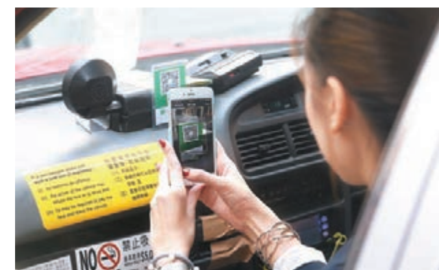
■ 流動支付必成大趨勢，但留意這不等於只有WeChat Pay HK或者支付寶。

日前，港鐵宣佈和騰訊名下的WeChat Pay HK合作，稍後推出兩者的流動支付解決方案，簡言之是香港居民可利用WeChat Pay HK購買車票，而內地遊客則可用微信支付(WeChat Pay)來購票。由於首批試點選址羅湖和落馬洲，可見使用對象是針對常走訪香港和內地的乘客。同時，另一流動支付系統支付寶也磨拳擦掌，將開始在港鐵推出類似服務。