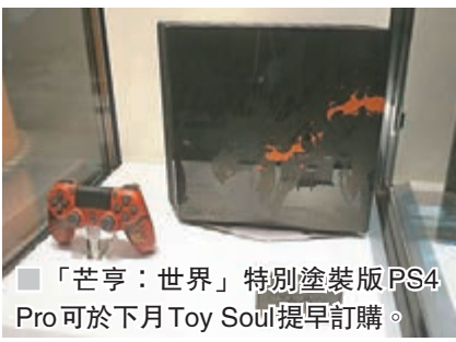
■「芒亨：世界」特別塗裝版PS4 Pro可於下月Toy Soul提早訂購。

這部「芒亨」機機身備有「雄火龍」吐出烈焰的特別圖案，手掣則是不作獨立發售之獨特紅色設定，再者附上《MHWW》遊戲光碟而非下載碼，收藏度爆燈(3,680港元)。這部主機將與遊戲同步推出，於下月15日至17日舉行之Toy Soul 2017率先接受訂購，每天限量50部，肯定「爭崩頭」。