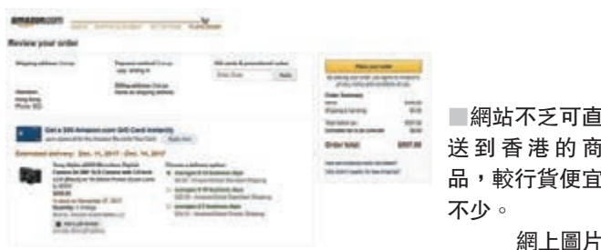
■ 網站不乏可直送到香港的商品，較行貨便宜不少。網上圖片

內地有「雙11」減價活動，香港多在臨近聖誕前有剪價促銷，至於遠在美國則會有更大型、更瘋狂的Black Friday(通常是感恩節後的周五)搶購潮。過往包括亞馬遜等網站，都不設寄來香港的做法，顧客要靠代購公司之類幫手，但現已能夠直接買回香港，只需稍加郵費便成。當然，並非所有產品都可運送來港，水貨相機亦沒有保養，同時像藍光碟等大多也不設中文字幕，落單前務必留意。