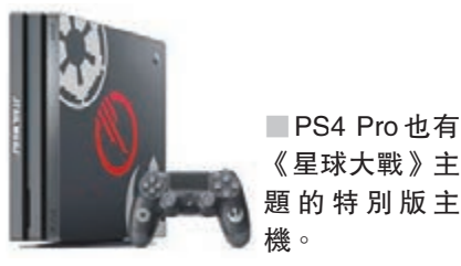
■ PS4 Pro也有《星球大戰》主題的特別版主機。