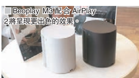
■ Beoplay M3配合AirPlay 2將呈現更出色的效果。

音箱Beoplay M3，備有黑色和自然灰兩種顏色的它，前者是採用鋁製鍍膜外罩，至於灰色那個則很特別，它的外罩用上丹麥頂級製造商Kvadrat的優質羊毛布料，除可令聲音播放得更柔軟外，也具備格外高檔的設計。還有，M3對應預定明年提供服務的Apple AirPlay 2，可簡單設定屋內的複數揚聲器播放什麼音源，如客廳和廚房播廣東歌、睡房則播英文歌，任你自由配對。每隻售價為2,698港元。