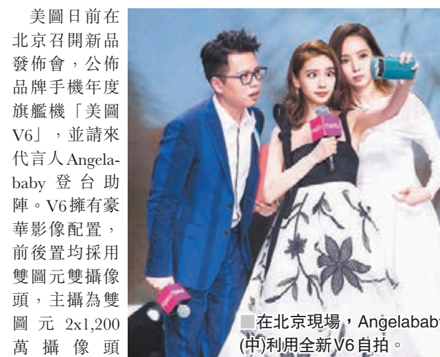
■ 在北京現場，Angelababy(中)利用全新V6自拍。

美圖日前在北京召開新品發佈會，公佈品牌手機年度旗艦機「美圖V6」，並請來代言人Angelababy登台助陣。V6擁有豪華影像配置，前後置均採用雙圖元雙攝像頭，主攝為雙圖元2x1,200萬攝像頭