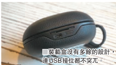
■ 裝載盒沒有多餘的設計，連USB接位都不突兀。

若提到音響產品中的貴族品牌，必然輕易想到會是來自丹麥的B&O，其產品即使不去用藝術品來形容，也有相當足夠的可觀性。日前該廠推出了全新無線耳機Beoplay E8，睇眼望起來和市面上的其他藍牙耳機分別不大，但只要把裝載盒拿上手就知龍鳳！皆因B&O不會採用膠作為外殼物料，必定會是皮革，那種細緻觸感確是其他產品所缺乏的。