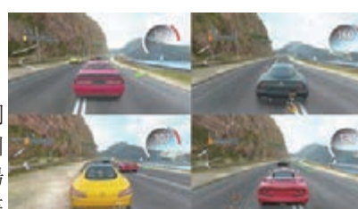
■ 《Gear.Club Unlimited》

曾開發《Test Drive Unlimited》的法國團隊Eden Games，本周五將於Switch上推出賽車遊戲《Gear.Club Unlimited》，今次亞洲版備有繁中、英文和日文顯示，不但保留原有的80款名車、430場賽事、200條以上賽道及可在自己的俱樂部車庫內任意改裝汽車等要素，還可作「一開四」畫面分割去玩，讓四名機迷可作競速對決。網上對戰模式則支援10人同時作賽。只要在香港指定商戶預購，有機會獲限量特典雨傘。