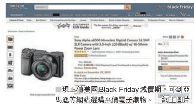
■ 現正值美國Black Friday減價期，可到亞馬遜等網站選購平價電子潮物。網上圖片

內地有「雙11」減價活動，香港多在臨近聖誕前有剪價促銷，至於遠在美國則會有更大型、更瘋狂的Black Friday(通常是感恩節後的周五)搶購潮。過往包括亞馬遜等網站，都不設寄來香港的做法，顧客要靠代購公司之類幫手，但現已能夠直接買回香港，只需稍加郵費便成。當然，並非所有產品都可運送來港，水貨相機亦沒有保養，同時像藍光碟等大多也不設中文字幕，落單前務必留意。