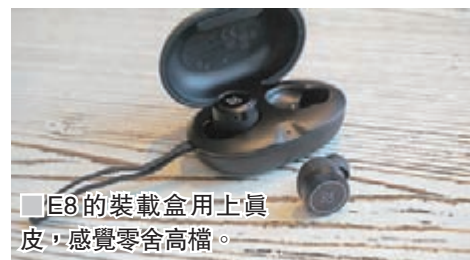
■ E8的裝載盒用上質皮，感覺零舍高檔。