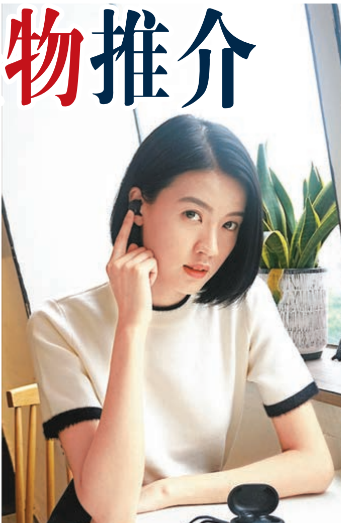
■ B&O的新款無線耳機Beoplay E8，除擁有一貫優質外形設計外，可單手操作亦是其賣點。

常出眾，之前推出的無線消噪耳筒QC35II可讓人隨時隨地沉醉在自己的音樂世界裡，而它的20小時電力無懼連續播放，就算從香港飛往紐約的航班也能播足全程。有黑、銀兩色的QC35II售價為2,888港元。