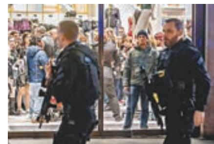
荷槍實彈的警員到現場搜索，群眾走進商店暫避。