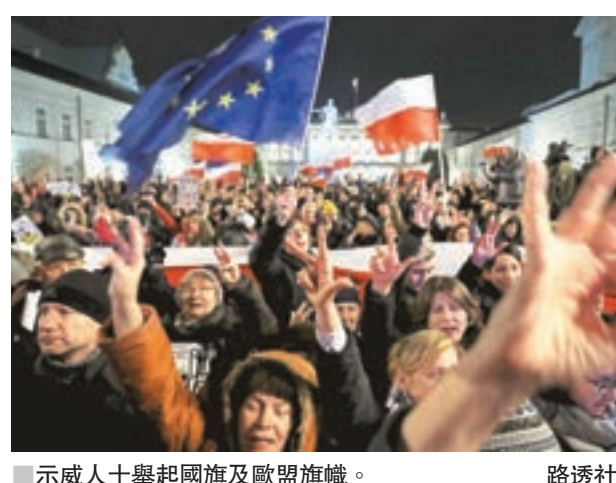
示威人士舉起國旗及歐盟旗幟。

提交眾院表決。反對派議員對杜達的提案表示失望，許多民眾亦認為修訂案根本沒有修改，仍是違反憲法，剝奪司法機關的獨立性。 歐盟威脅實施制裁 不少年輕人上街遊行示威，沿途高呼「法院自由、選舉自由、波蘭自由」口號，有示威者表示，他不會同意導致波蘭離開歐盟的法律。歐盟指波蘭的司法改革法案不符合歐盟法律，威脅實施制裁。 ■英國廣播公司/路透社/法新社/美聯社