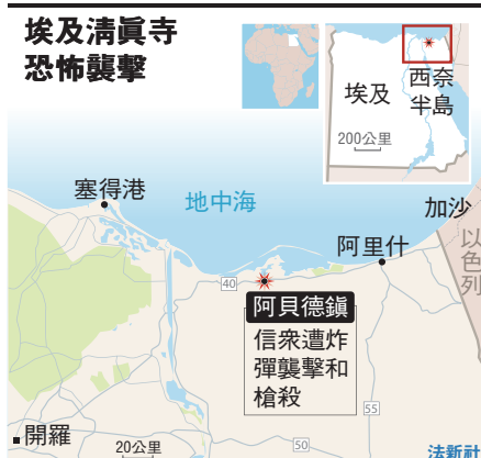
埃及清真寺恐怖襲擊

北西奈省過往也曾發生多次恐怖襲擊，但主要針對警察或保安部隊，針對平民的大型襲擊較少見。2014年10月一宗造成30多名士兵死亡的襲擊後，埃及政府宣佈北西奈省進入緊急狀態至今，但其