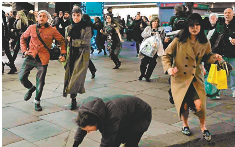
購物人潮聞槍聲即時爭相走避，有人慌忙跌倒。