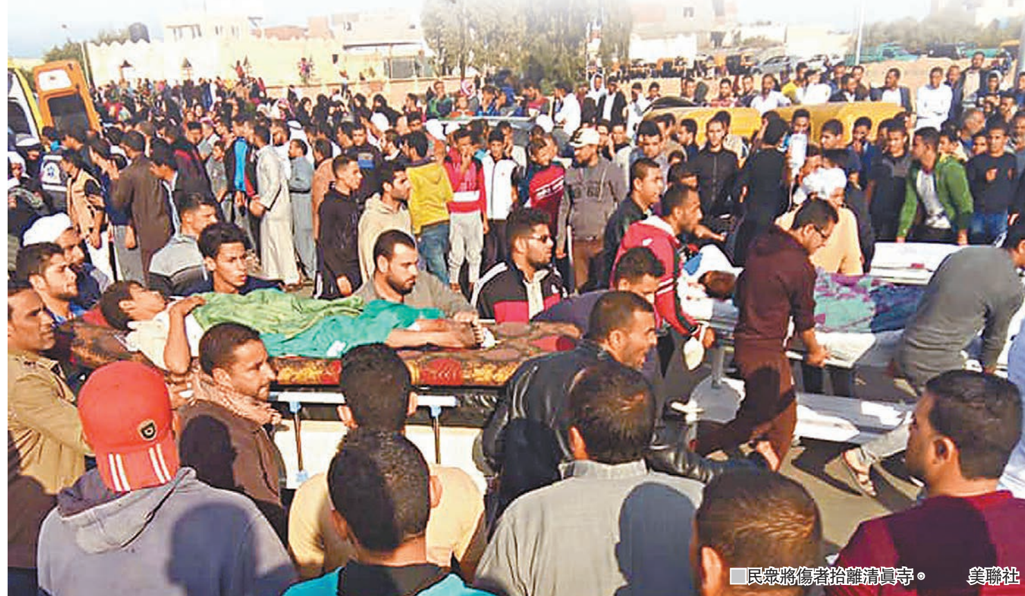
民眾將傷者抬離清真寺。

埃及西奈半島清真寺前日發生的恐怖襲擊，死亡人數增至最少305人，另有128人傷，死者包括27名小童。雖然未有組織承認責任，但埃及當局相信是極端組織「伊斯蘭國」(ISIS)埃及分支「伊斯蘭國西奈省」所為，總統塞西誓言要「以牙還牙」，空軍隨即空襲多個恐怖分子據點，殺死多人。遇襲地點北西奈省自2014年起實施緊急狀態，但以「西奈省」為首的極端勢力剿之不盡，分析認為埃及當局應該以今次襲擊為契機，加大打擊恐怖組織力度。